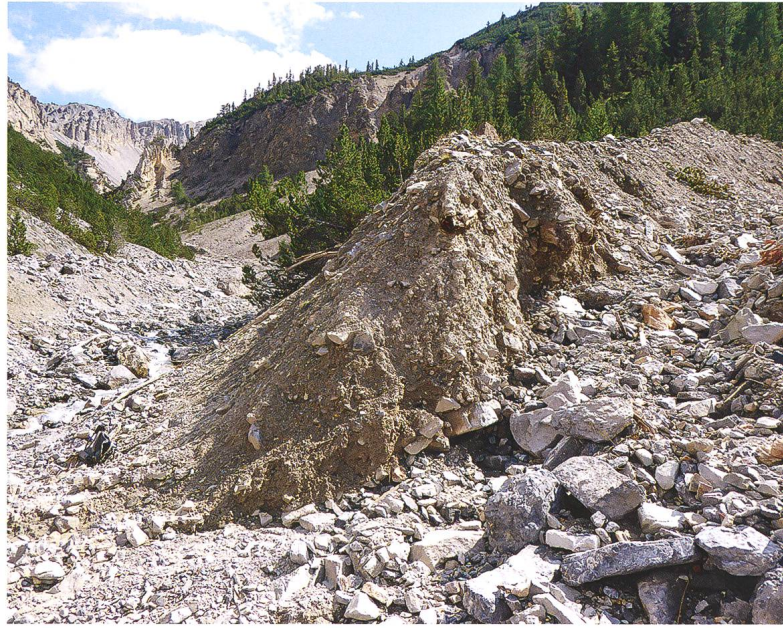
Abb. 4: Der Ansatz des Schuttkegels mit nach Osten einfallender Schichtung in der Val Chavagl beim Zusammenfluss der beiden Rinnen. Aufnahme rinnenaufwärts, mit dem einsedimentierten Holzlager. Vom kleineren Stamm, der aus der Böschung nach Osten hinausragt, stammen die beiden Radiokarbonproben, die im August 2018 genommen wurden.