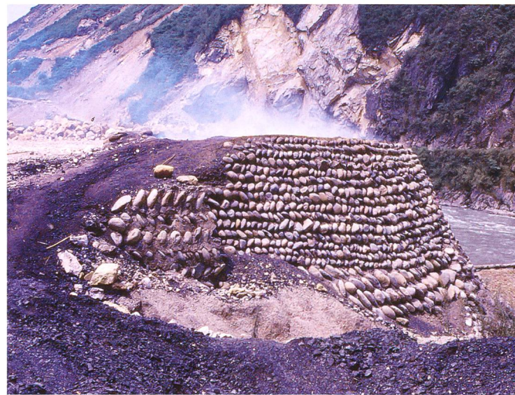
Abb. 3: So hat es wohl vor 300 Jahren im Ofenpassgebiet geraucht und gequalmt: Strassenbaustelle und Rohstoffversorgung 1991 vor Ort in China, westlich von Chengdu.

Somit bleibt die stratigraphische Analyse des Schuttkegels (Ansatz 2). Die Stratigraphie beruht auf dem Erkennen verschiedener, übereinander gelagerter Schichten, die anhand ihrer Grenzen als solche erkennbar sind. Beim Ofen selbst sind in der Böschung des Schuttkegels keine Schichtgrenzen sichtbar, ebenso wenig im Bereich des Ofenfundaments. Die Sedimente, in denen die Ofenruine steckt, ist ein nicht weiter gliederbarer, blockiger Kies mit geringem Feinanteilgehalt und mit Blöcken von über 1,5 m Durchmesser. Die Mächtigkeit dieses blockigen Kieses beträgt ab Fundamentrest bis zur Terrassenoberkante ca. 6,5 m. Mit anderen Worten: Um diese Höhe hat sich die Ova da Val Chavagl seit dem Ereignis, das den Ofen begraben hat mindestens wieder eingetieft. Auch wenn die Ova da Val Chavagl heute linksufrig die Böschung erodiert, so dürfte sie zumindest zeitweise auch Material ablagern. Der Aufbau eines Schuttfächers beruht auf akkumulativen Einzelereignissen mit unterschiedlicher seitlicher Wechselwirkung. Zwischen den einzelnen Ereignissen müssten also Schichtlücken sichtbar sein. Im Idealfall finden sich an solchen Schichtgrenzen eingelagerte Vegetationsreste, die eine Datierung erlauben könnten.