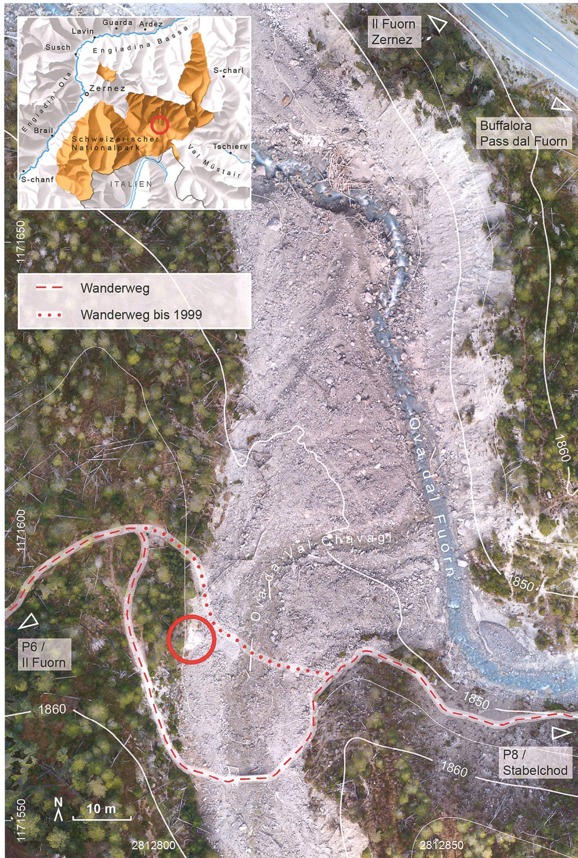
Abb. 2: Situationsplan vom Zusammenfluss von Ova da Val Chavagl und Ova dal Fuorn mit altem und neuem Wanderweg. Im roten Kreis liegt die Ofenruine (Orthofoto basierend auf Drohnenflug vom 18. Oktober 2018). Autor GIS SNP @ Schweizerischer Nationalpark [TE], Daten: Schweizerischer Nationalpark, swisstopo).