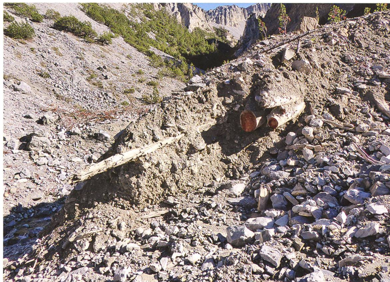
Abb. 5: Das Lärchenholzlager in der Val Chavagl, am 8. August 2019, ein Jahr nach der Beprobung für die Radiokarbondatierung und nach weiterer erosiver Freilegung.

Die Lärchenstämme des Holzlagers liegen mit einer Ausnahme (quer zum Rest) auffallend parallel: Die Wurzelstöcke liegen hangaufwärts im Sediment und die Ausrichtung der Stämme belegt die Einmuerung, also die Fixierung der Stämme durch einen