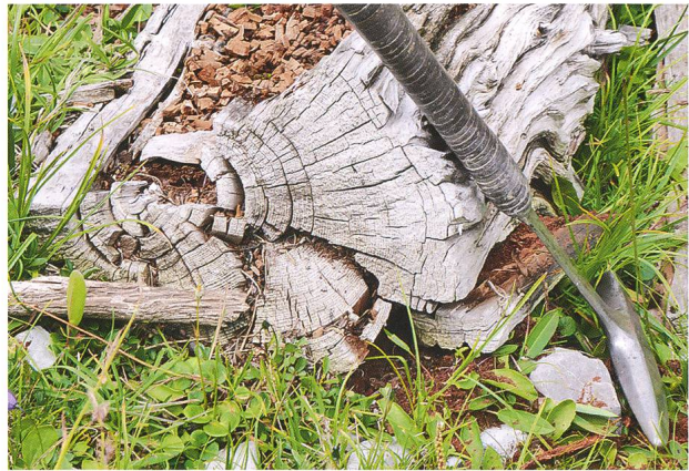
Abb. 8: An Proben von diesem Lärchenstamm auf Margunet (aufgenommen am 26. Juli 2019) sind Radiokarbonmessungen durchgeführt worden, die annehmen lassen, dass dieser Baum ebenfalls in der Mitte des 17. Jahrhunderts abgestorben ist, also in der gleichen Zeit, als die Lärchen und der Kalkbrennofen in der Val Chavagl von einem Murgang eingesedimentiert wurden (Foto: Ch. Schlüchter).

Dieses Alter ist im hier diskutierten Kontext beachtenswert, denn auch dieses Messresultat liegt im Bereiche des Vinci Plateaus sensu Hajdas und muss, der Argumentation zu der Altersstellung der subfossilen Lärchen in der Val Chavagl folgend, kurz nach 1638, eventuell in den 1640er-Jahren abgestorben sein. Der Stamm auf Margunet wurde mit einer Säge abgeschnitten, was natürlich irritiert (Abb. 8). Es ist jedoch nachvollziehbar, dass der noch einigermaßen verwertbare Teil des Stammes genutzt worden ist. Die heutige Lage des Stammes dürfte in der Nähe des Baumwachstums liegen. Eine Verfrachtung durch Lawinen Richtung Tal darf allerdings nicht ausgeschlossen werden. Ein Wuchsstandort im Gebiet von rund 200 m über der heutigen lokalen Baumgrenze ist wahrscheinlich.