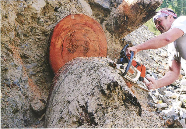
Abb. 6: Nationalparkwächter Fadri Bott sägte am 8. August 2019 erfolgreich eine Scheibe vom grössten zugänglichen Stamm ab (Probe CS-Chavagl-02). Deutlich ist die Stauchung des Stammes mit horizontaler Krafteinwirkung durch den Murgang zu erkennen.