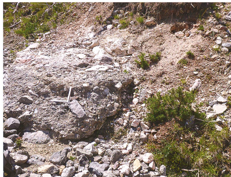
Abb. 1: Das Bild wurde im August 2018 bachaufwärts aufgenommen mit Blick auf die linksufrige Terrassenböschung der Ova da Val Chavagl mit der freigespülten Ofenruine. Insbesondere deren flaches Fundament und die weissen Sinterblöcke in der Böschung sind sichtbar.

Am 10. September 2017 wurden in der westlichen Böschung der Val Chavagl zwischen dem heutigen und dem ehemaligen Wanderweg über den Bach auffallend weisse Komponenten festgestellt (Koordinaten N 46.66153, E 10.21972). Bei einer ersten Inspektion wurden sie als Rest- oder Bruchmaterial eines Kalkbrennofens identifiziert. Eigenartig an der Situation ist der Umstand, dass die Reste des Ofens in der Böschung stecken, also Teil des Materials darstellen, das die Böschung aufbaut und nicht einfach an der Böschung angelagert bzw. von oben über die Böschung geschüttet sind. Der Rest eines alten, ehemaligen Kalkbrennofens ist Teil der Terrasse. Er ist in der Folge eines Unwetters um Munt Chavagl – Munt la Schera durch das Material, das heute die Böschung aufbaut, überdeckt, geologisch gesprochen einsedimentiert worden (Abb. 1). Der 2019 sichtbare Durchmesser des Fundaments beträgt 2,80 m.