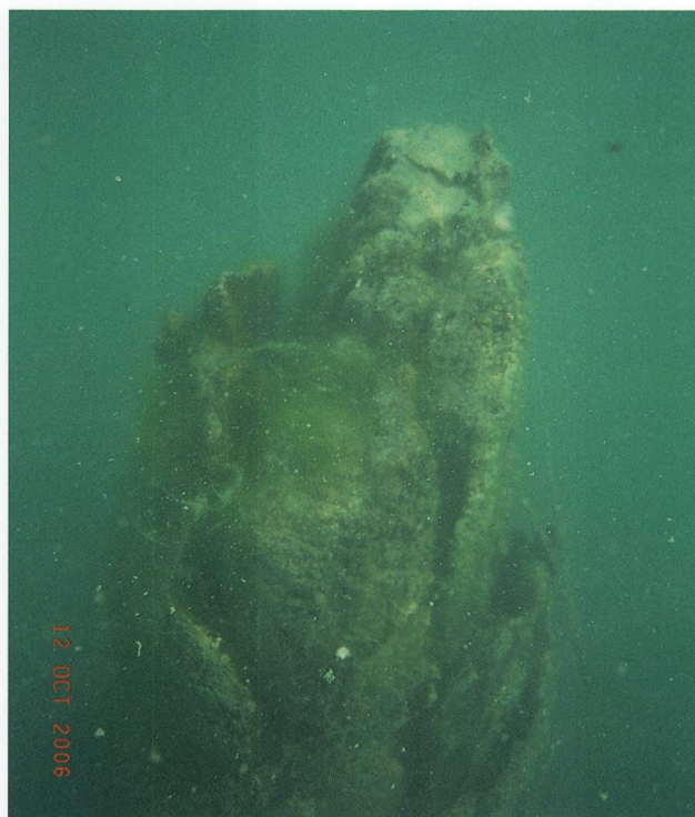
Abb. 4: Die Krone des grossen Lärchenstammes (Baum SP-2) im Silvaplana-See befindet sich nur 1,3 m unter dem Seespiegel.

zur Umgebung der Bäume im Silsersee, wo nur vereinzelte Aststücke auf dem Seegrund liegen, wurde zwischen den beiden Stämmen im Silvaplana-See viel Totholz mit mindestens einem grösseren Stamm (SP-3), der praktisch sedimentfrei ist, entdeckt. Die kleinen Hangschuttfächer erreichen die Bäume hier noch nicht. Bei den beprobten Unterwasserbäumen im Silvaplana-See handelt es sich ausschliesslich um Lärchen. Aus dem Silsersee ist je ein Baum als Lärche beziehungsweise Fichte bestimmt worden. Bei den übrigen Streuproben handelt es sich um nicht weiter bestimmte Nadelhölzer.