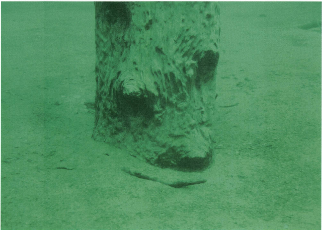
Abb. 3: Basis der Lärche (Baum SI-1) im Silsersee in 28 m Wassertiefe im flachen, ungestörten Seegrund. Der Wurzelstock lässt sich nur noch erahnen und ist um einige Dezimeter einsedimentiert. Dieser Baum wurzelt sicher nicht in der sichtbaren Ablagerung. Der Baumumfang beträgt ca. 113 cm über Grund. Vergleiche auch Abb. 2.

Die beiden Bäume im Silvaplanersee stehen ebenfalls in flachem Seegrund in ca. 15 m beziehungsweise 20 m Entfernung vom recht steilen, felsigen Ufer bei Fiuors. Baum SP-1 steht, leicht geneigt, ca. 20 m vom Ufer weg in 12,5 m Wassertiefe und mit der Krone 3,2 m unter Wasserspiegel. Der Umfang beträgt 98 cm. Baum SP-2 steht ca. 15 m vom Ufer weg in 6,9 m Wassertiefe und endet mit der Krone nur 1,3 m unter Wasserspiegel (Abb. 1, Abb. 4). Sein Umfang beträgt 290 cm. An der Stammbasis ist die Verbreiterung zu einem Wurzelstock sichtbar. Im Gegensatz