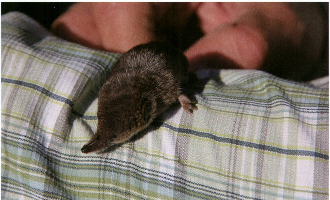
Abb. 1: Walliser Spitzmaus in Donat, Graubünden.

Die Walliser Spitzmaus ( Sorex antinorii , Abb. 1) wurde lange Zeit als Chromosomenrasse der Waldspitzmaus ( Sorex araneus ) betrachtet. Die Forschungsgruppe von Prof. Jacques Hausser, Université Lausanne, konnte mit morphologischen, chromosomalen und genetischen Methoden zeigen, dass sich die Walliser Spitzmaus ( Sorex antinorii ) klar von ihrer Schwesterart unterscheidet (BRÜNNER et al. 2002). Es wird aus genetischen Untersuchungen auch geschlossen, dass mögliche Hybride zwischen Sorex antinorii und Sorex araneus unfruchtbar sind (YANNIC et al. 2008). Das Verbreitungsgebiet der Walliser Spitzmaus umfasst Italien (AMORI et al. 2008), das sie mit Ausnahme von Sizilien und Sardinien grossflächig besiedelt sowie Teile der französischen und Schweizer Alpen. In der Schweiz kommt sie im Oberwallis und im Tessin regelmässig vor, zudem im Hasli-, Gadmen- sowie Urserental und im Kanton Uri auch nördlich der Schöllenschlucht (CSCF 2017). MADDALENA et al. (2006) stellten sie in den Bündner Südtälern Misox und Calanca verbreitet fest. Kürzlich gelangen auch genetische Nachweise in der Val di Campo (Puschlav) und im Bergell (CSCF 2017). Paul Marchesi (2005, schriftliche Mitteilung) fing einige Tiere nördlich des Lukmanierpasses in der Val Me-