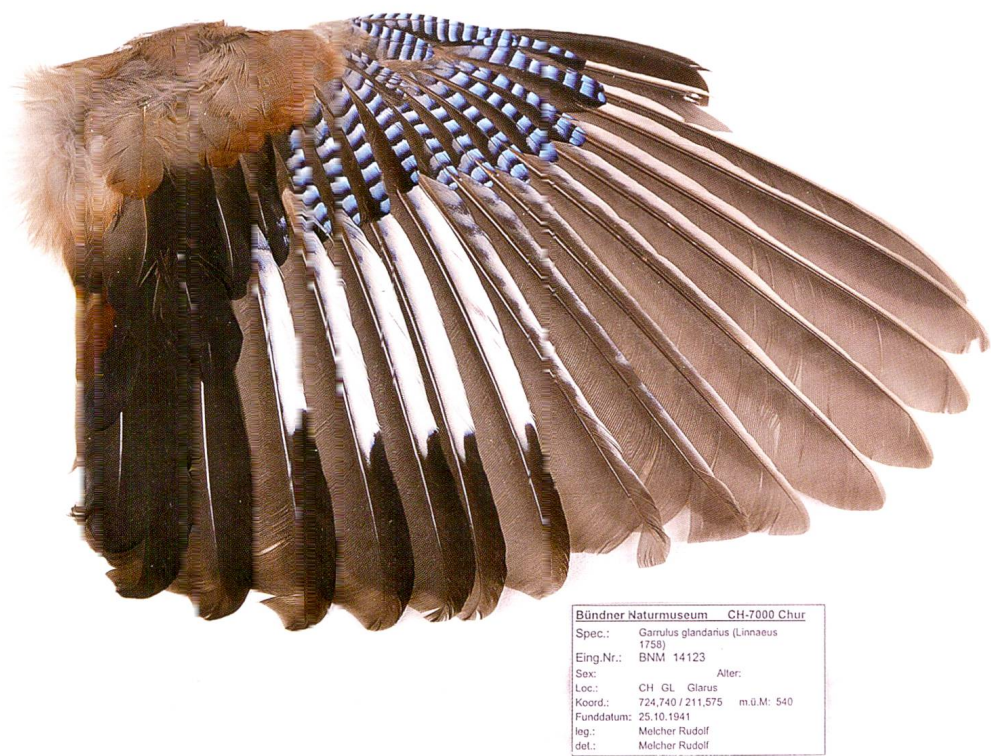
Abb. 5: Flügel eines Eichelhähers ( Garrulus glandarius ) aus der Gefiedersammlung von Rudolf Melcher (Foto: Bündner Naturmuseum).