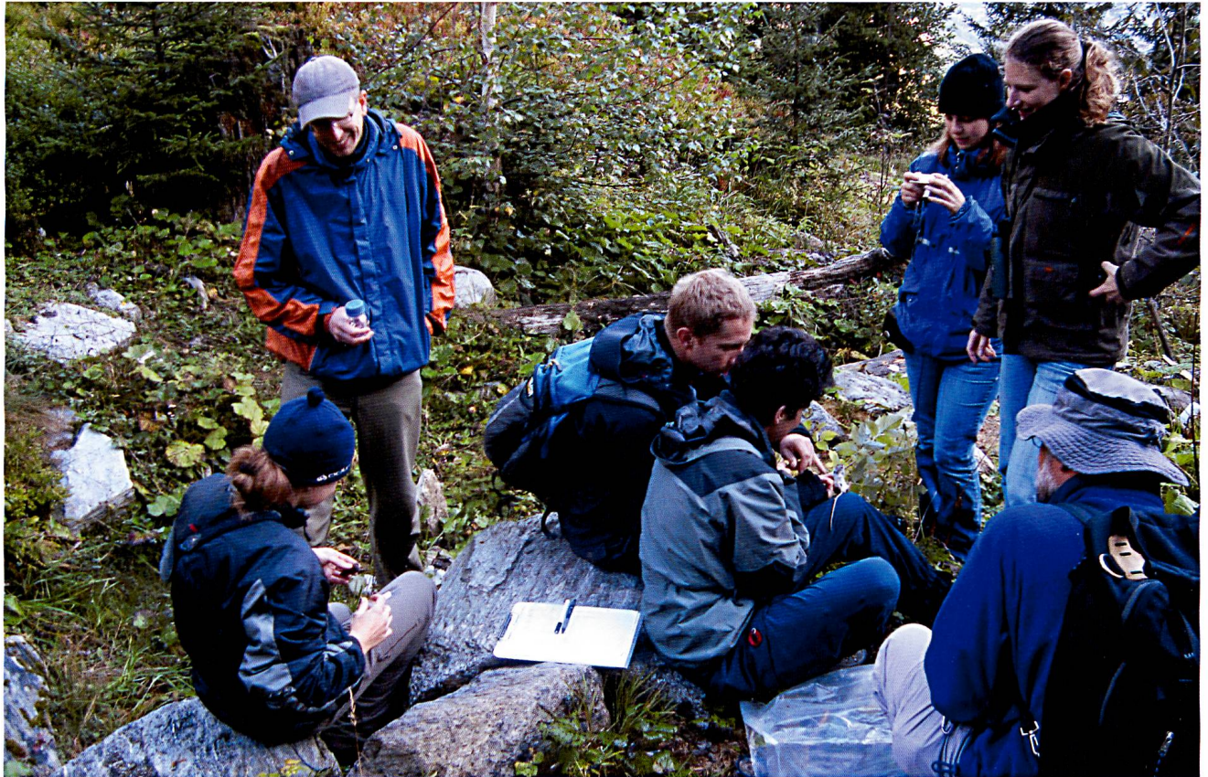
Die Säugercamps fanden in verschiedenen Regionen des Kantons statt.

Kantons, in der übrigen Schweiz und sogar im Ausland gezeigt. Die mit Unterstützung des BNM vom Zoologischen Museum der Universität Zürich realisierte Ausstellung über den Steinbock gastierte im Museo Civico di Storia Naturale di Roma.