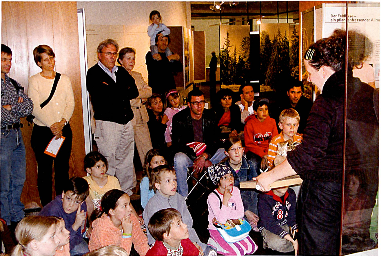
Das Museumspädagogische Angebot des Museums stösst in jeder Hinsicht auf ein grosses Interesse.

Neben den Kindern und Jugendlichen richteten sich museumspädagogische Veranstaltungen auch an Erwachsene: So wurden zum Beispiel Tiermärchen nur für Erwachsene angeboten, im Rahmen des Lernfestivals naturkundliche Kurse organisiert oder Abendführungen durch die Ausstellungen durchgeführt. Sowohl der Museumsdirektor als auch der Museumspädagoge hielten in verschiedenen Regionen Graubündens Vorträge zu ganz unterschiedlichen naturkundlichen Themen und erreichten so viele Naturinteressierte ausserhalb des Museums.