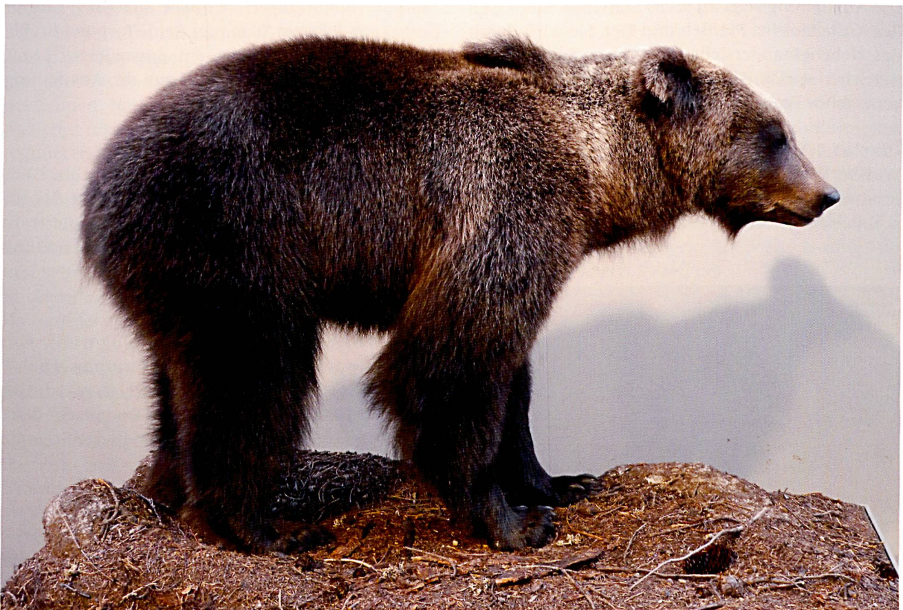
Der Bär JJ3 wurde im Frühjahr 2008 am Glaspas erlegt. (Foto BNM).

Sonderausstellungen sind eine einmalige Gelegenheit eine Auswahl der vielen Themen, welche in den ständigen Ausstellungen nicht gezeigt wer-