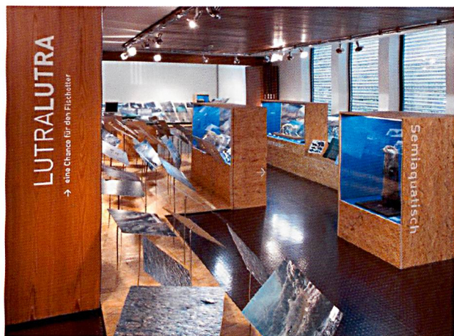
Sonderausstellung «Lutra lutra – eine Chance für den Fischotter». (Foto BNM).