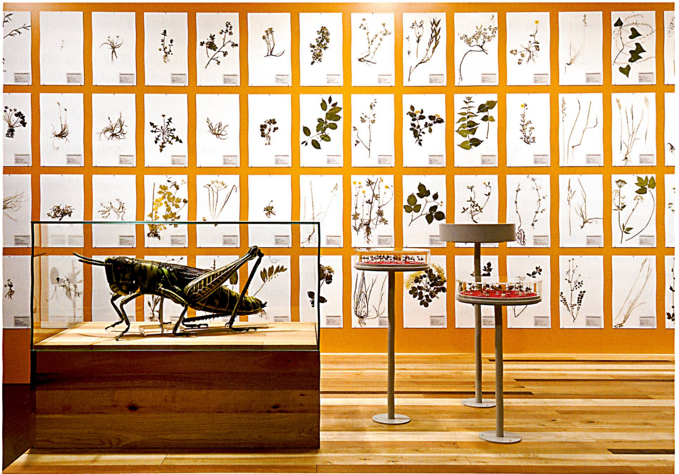
Ein Blick in die neue Dauerausstellung im 1. OG zum Thema Biodiversität.

nierten Reihenfolge präsentiert. Die Besucherinnen und Besucher wählen ihren Rundgang selbst und entdecken so die Vielfalt auf individuelle Art und Weise. 4 spiralförmige Module in den 4 Ecken des Raumes vermitteln etwas Theorie. Dargestellt werden die Themen «Die Entstehung der Vielfalt im Laufe der Evolution», «Was ist eine Art?», «Die Bedeutung der Vielfalt in den Ökosystemen» und «Die Bedeutung der Vielfalt für den Menschen». Im Forscherlabor erhalten Jung und Alt Gelegenheit, interessante Objekte selbst in die Hand zu nehmen und zu studieren. Ein interaktives System erlaubt zudem einen Einblick in die wissenschaftlichen Sammlungen des Museums.