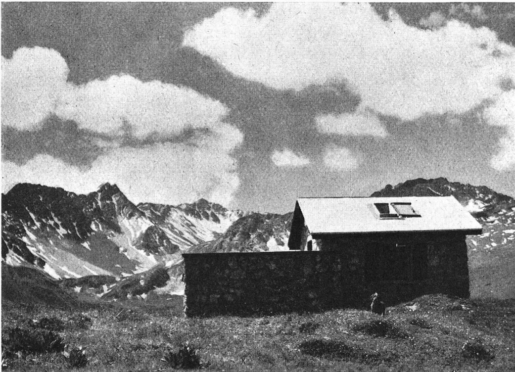
Abb. 3. Außenstation auf Tschuggen (2040 m).

Grundsätzliches zur Frage Föhn-Scirocco und vielversprechende Hinweise auf eine umfassende Gesetzmäßigkeit im Wettergeschehen unserer Atmosphäre.