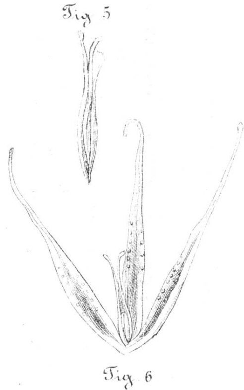
Gentiana excisa monstrosa.