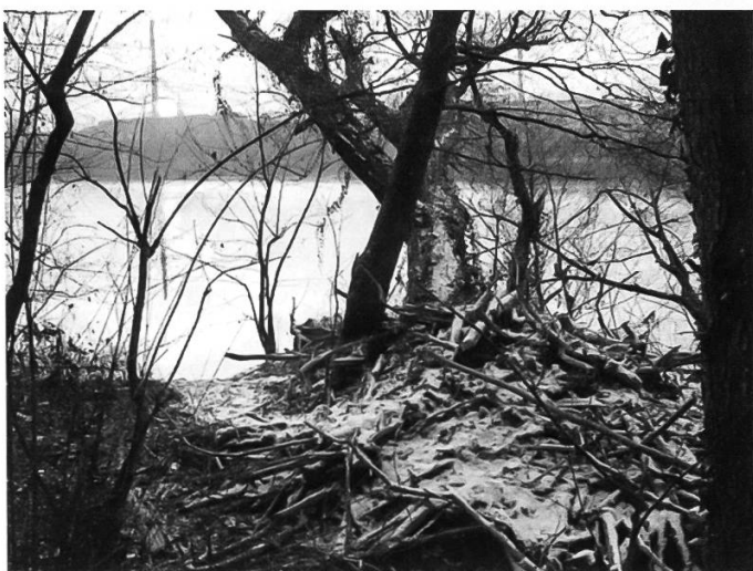
Abb. 2: Eine Biberburg beim Beuggenboden (Rheinfelden, Aargau). Der Standort ist in Abb. 1 mit «1» markiert.