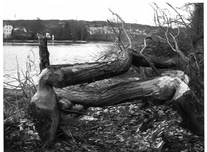
Abb. 3: Ein Fress- und Fällplatz des Bibers beim Beuggenboden (Rheinfelden, Aargau). Der Standort ist in Abb. 1 mit «2» markiert.