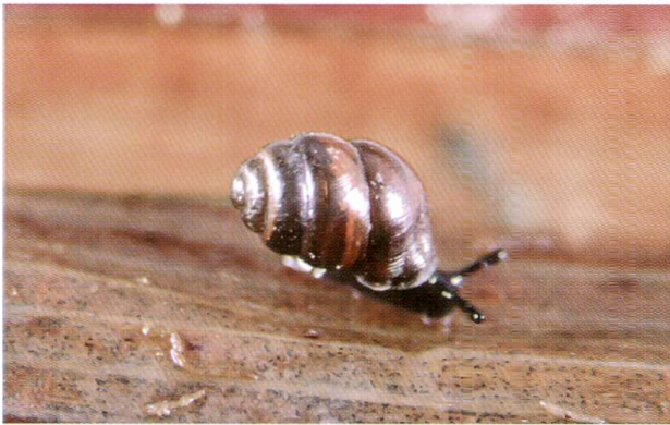
Abb. 2: Sumpfwindelschnecke ( Vertigo antivertigo ).