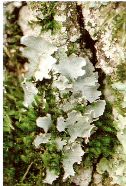
Abb. 2: Die wärmeliebende und gesamtschweizerisch stark gefährdete Parmotrema stuppeum besitzt auf Wildenstein eines ihrer wenigen Vorkommen nördlich der Alpen.