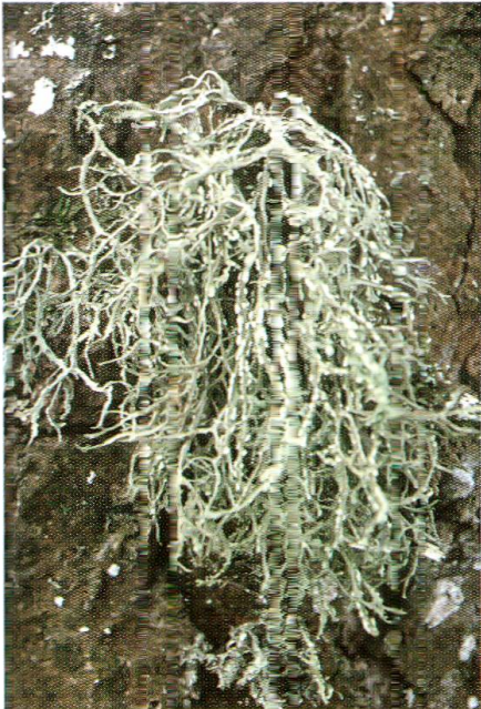
Abb. 5: Ramalina farinacea ist typisch für kühle und luftfeuchte, aber lichtreiche Standorte. Sie ist an den entsprechenden Standorten häufig.