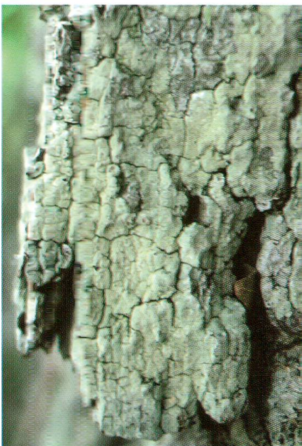
Abb. 3: Pertusaria flavida besitzt in der Schweiz grosse Verbreitungslücken. Ausser auf Wildenstein wurde die vergleichsweise auffällige Krustenflechte bisher fast ausschliesslich in alten Kastanienselven des Bergells gefunden.