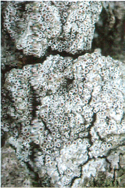
Abb. 1: Gyalecta ulmi ist auf lichte, alte, ungestörte Baumbestände angewiesen. Die stark zurückgegangene und in allen europäischen Ländern hochgradig gefährdete Art besitzt auf Wildenstein ihr grösstes schweizerisches Vorkommen.