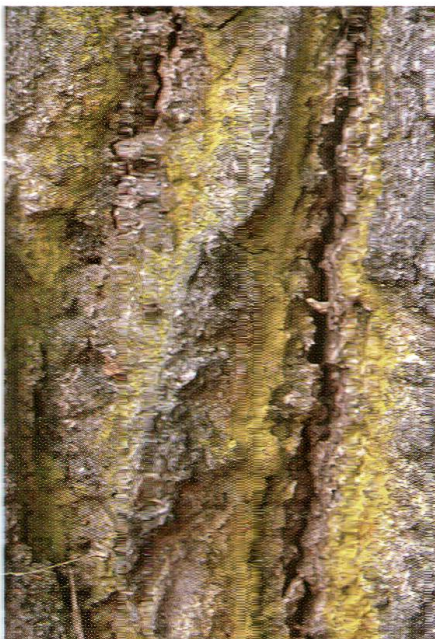
Abb. 7: Die leuchtend gelbe Chrysothrix candelaris besiedelt heute vorzugsweise alte Tannen in naturnahen Bergwäldern. Früher kam die Art verbreitet auch in Borkenrissen alter Eichen vor. Auf den Wildensteiner Eichen ist die Art immer noch recht häufig anzutreffen.