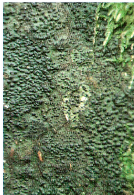
Abb. 4: Pyrenula nitidella charakterisiert die glatte Borke von Buchen in den kühlfeuchten Gräben des Naturschutzgebiets.