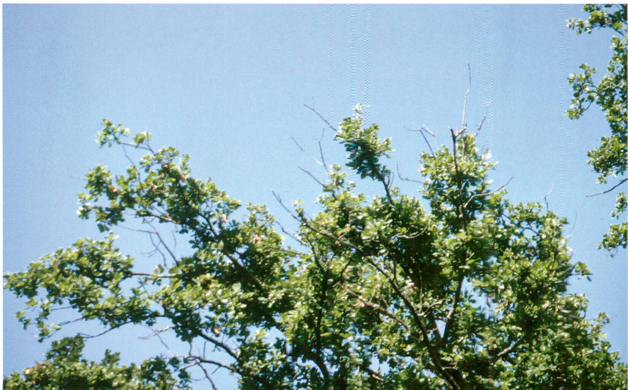
Abb. 3: Durch Phomopsis-Befall verursachtes Triebsterben.