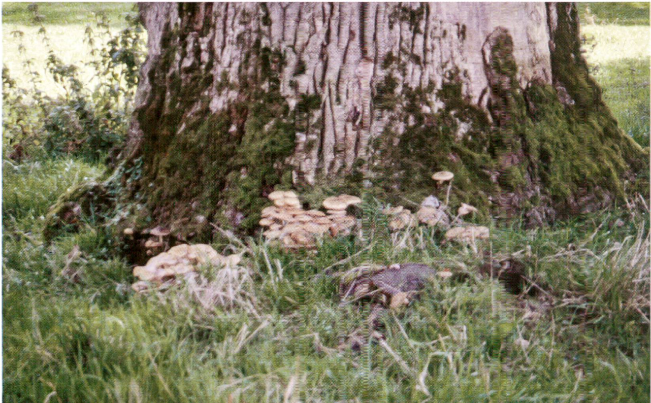
Abb. 2: Fruchtkörper von Hallimasch ( Armillaria mellea ) am Stammfuss einer Eiche.