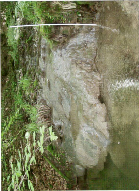
Abb. 2: Sinterterrasse im Oberlauf des Sormattbächli (Standort 8). Massstab rechts aussen 2 m.