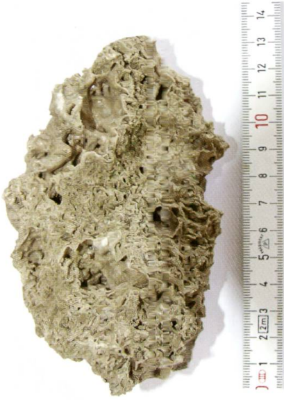
Abb. 3: Handstück aus Quellkegel südlich des Schlosses (Standort 2). Mürber, hochporöser Kalktuff, beige, mit drusigen Calcitausfällungen in Hohlräumen, Abdrücke von Blättern und Ästen.