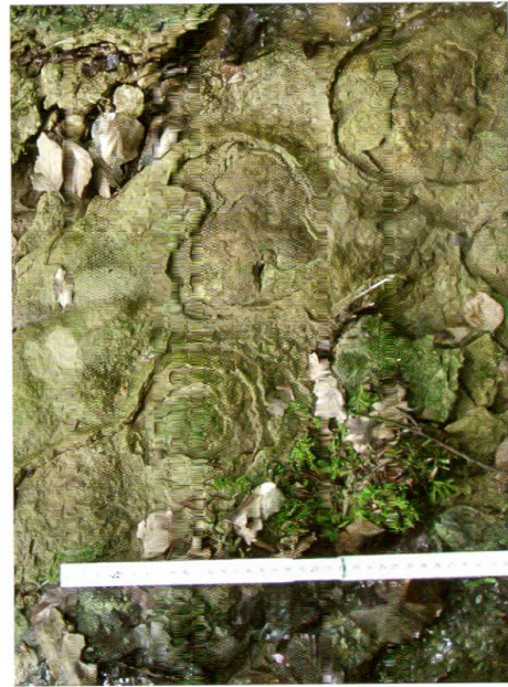
Abb. 4: Kalktuffverwitterung im Sormattbächli. Wo Wasser über längere Zeit hinweg fehlt, beginnt Erosion und Zerfall des Kalktuffs – hier in Form von plattigen Abschalungen. Massstab links 35 cm (Standort 8).