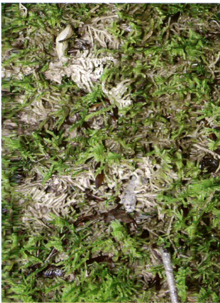
Abb. 6: Anfangsstadium der Kalktuffbildung. Bildung von Calcitkrusten um Moosstäbchen und Einfangen von Schwebestoffen aus dem Wasser – Reusenwirkung. Bildbreite ca. 10 cm (Standort 9).