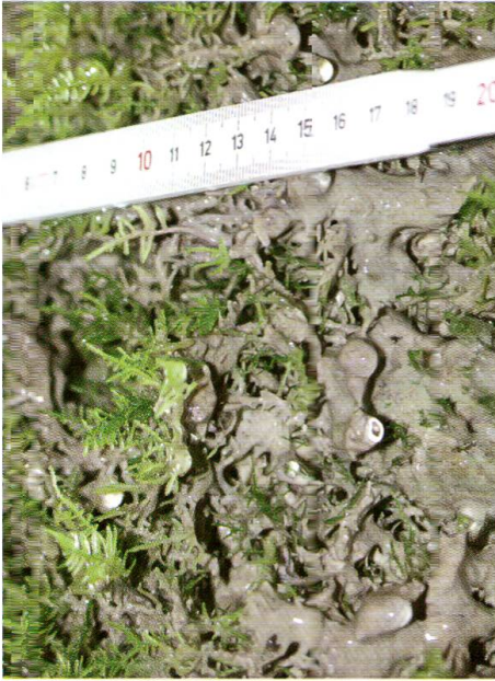
Abb. 7: Umkrustete Moosstäbchen verwachsen miteinander und sterben ab. Hohlräume versintern. Organisches Material wird teilweise miteingebaut (Standort 9).