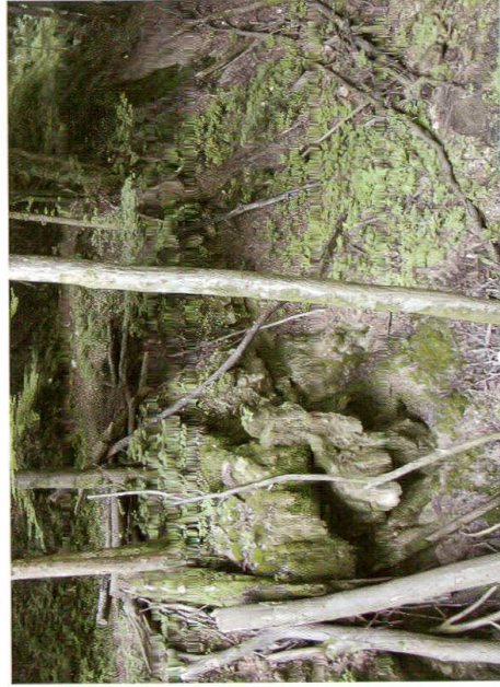
Abb. 5: Quellhorizont mit Kalktuffen im Allmentgraben (Standort 9). Die Quellen treten auf der Höhe der Strasse aus und bilden bei einer Härterippe der Sequankalke Kalktuffzapfen, teilweise verkalkte Moosgirlanden und Kalktuffkegel.