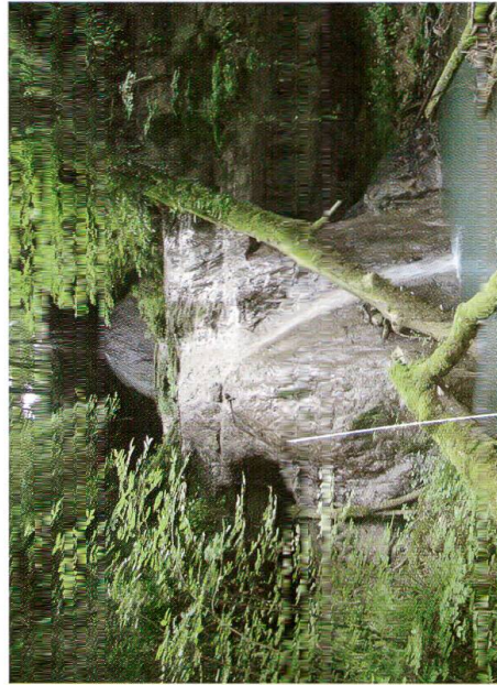
Abb. 9: Kalktuffzapfen im Sormattbächli bei unterer und oberer Härterippe im Hauptrogenstein, südlich des Schlosses (Standorte 5 und 6). Massstab links der Bildmitte 2 m.