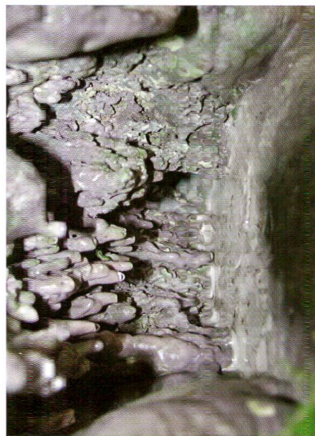
Abb. 8: Versinterung der Kalktuffhohlräume und Bildung von Tropfsteinphänomenen. Insbesondere bei Kalktuffvorhängen und Moosgirlanden kann es zur Bildung von Grotten kommen. Bildbreite ca. 20 cm (Standort 9).