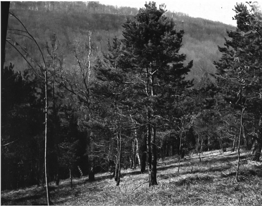
Abb. 41: Kilchholz Arlesheim 1925. Mit Pfeifengras und Fiederzwenke vergrastetes Waldstück mit lockerer Föhren- und Mehlbeerenbestockung. Ehemalige Brandfläche. Vermutlich wurde diese Fläche, die zum Bürgergemeindeland gehört, bis ins 20. Jahrhundert hinein beweidet. In der Krautschicht des lichten Waldes kamen, begünstigt durch den wechselfeuchten Boden, die frühere Beweidung und die Brände, etliche Magerwiesepflanzen, z.B. die Knollenspierstaude, vor.