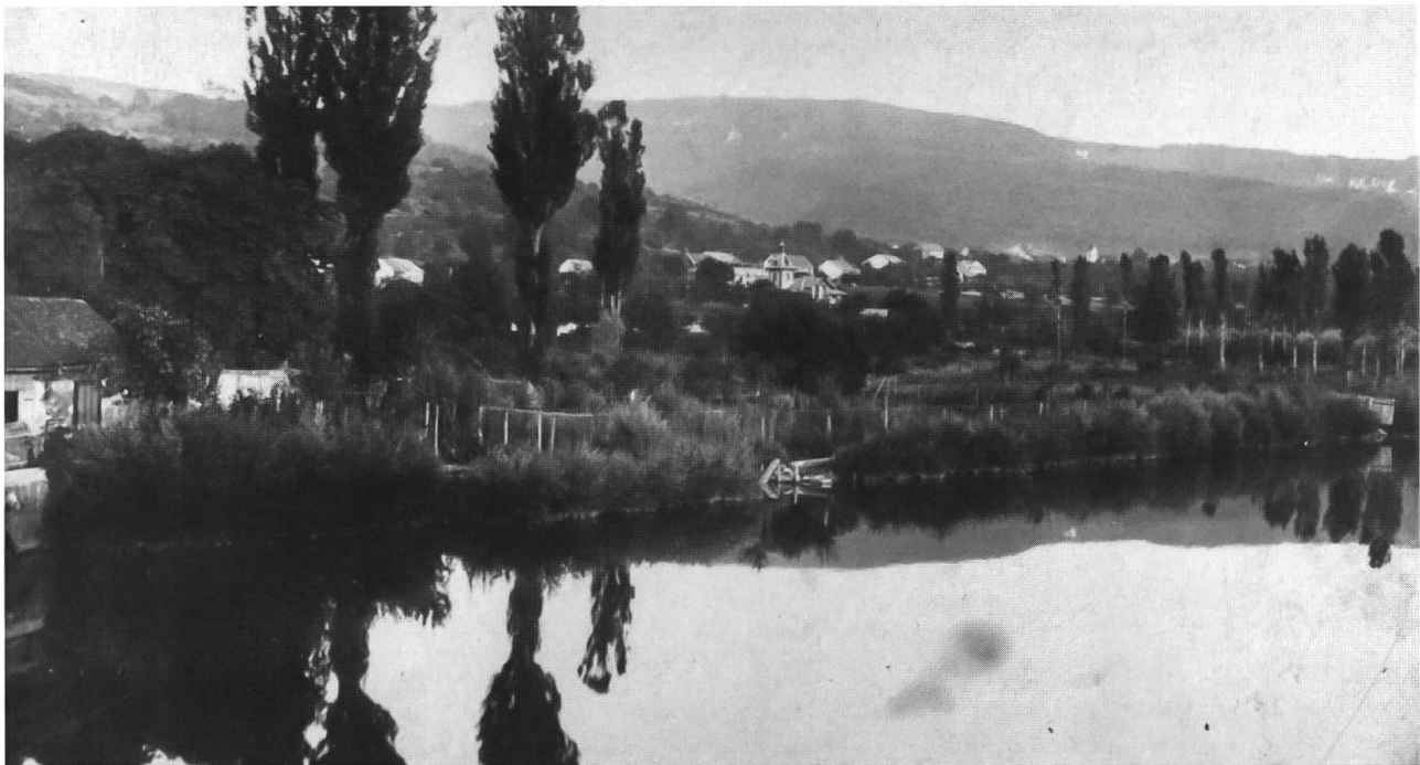
Abb. 19: Birs bei Dornachbrugg 1895 (also noch vor der Korrektur von 1900). Die Uferlinie gegen den Hauptarm ist mit Faschinen gesichert. Das dahinter liegende Weidengebüsch ist von Wasserläufen, in denen Wasserpflanzen gediehen, durchzogen. Die Bäume sind weitgehend abgeholzt. Die Funktion der zaunartigen Holzkonstruktion ist unklar. (Fischzuchtanstalt?). Die Birs war durch ein Wehr der Schappe-Fabrik leicht aufgestaut.

feststellungen konserviert werden. Der noch offen fließende Schwinbach ist heute auf seiner ganzen Länge mit Gehölzen bestockt. Der ökologische Wert dieser neuen Hecken ist jedoch wenigstens zum Teil in Zweifel zu ziehen: An der steilen Niederterrassenböschung wuchsen Gehölze an Stelle von artenreichen Magerrasen auf. Neu gepflanzte Hecken stocken oft auf allzu nährstoffreichen Böden, was die Gehölze rasch wachsen lässt und dazu führt, dass sich weder im Innern noch am Saum der Hecken eine natürliche Krautvegetation ausbilden kann. Ausserdem sind die heutigen Gebüsche und Hecken meist von Baumarten wie Esche, Kirschbaum oder Feldahorn dominiert, da sie nicht wie früher regelmässig auf Stock gesetzt werden. Neben den Scherrasen sind Gehölze das wichtigste Element der Siedlungsnatur, wobei etwa zwanzig nicht einheimische Hartlaub- und Ziergehölze regelmässig angepflanzt werden. Über die Häufigkeit der einheimischen Gehölze in der Siedlung gibt es jedoch keine systematischen Beobachtungen. Womöglich ist der Anteil an einheimischen Arten viel höher, als man vermuten würde.