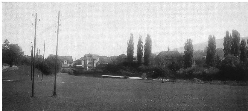
Abb. 15: Bruggfeld (Aesch) um 1930. Wiese im Hochwasserüberschwemmungsbereich der Birs, von der etliche Nasswiesenarten, z.B. der Sumpfschachtelhalm, nachgewiesen sind. Heute ist das Terrain durch Auffüllung bis auf die Höhe des Geländers der Nepomukbrücke angehoben.

Auf (ehemaligen) Nassestandorten konkurrenziert heute vor allem der Maisanbau den naturnahen Wiesenbau. Nasse Mulden in der Ebene und in den Tälchen waren – vor allem seit den 1970er-Jahren – beliebte Deponiestandorte für Aushubmaterial. Verschiedene Nasswiesen sind in den letzten hundert Jahren auch verwaldet, z.B. entlang des Lolibachs. Dabei verschwinden im aufkommenden Eschenwald die Pflanzen des Offenlandes.