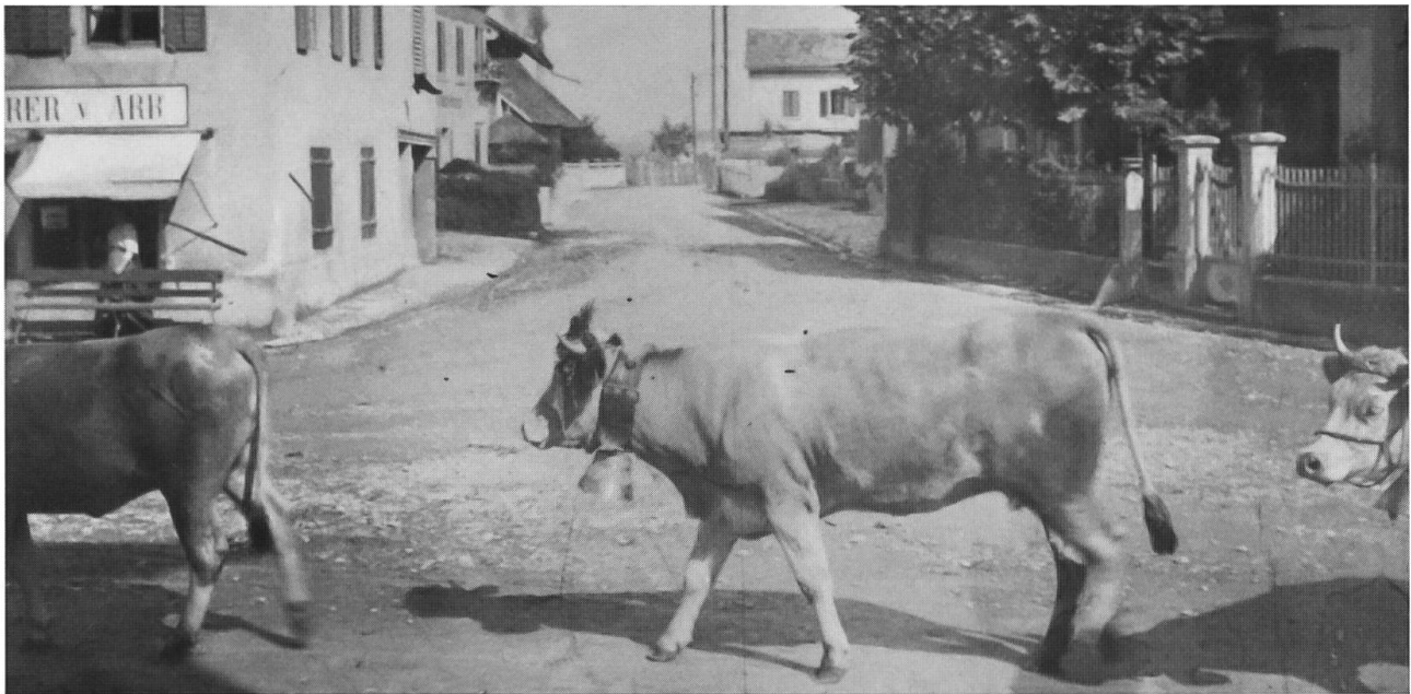
Abb. 35: Kühe auf dem Hauptplatz in Dornachbrugg 1900 (heute Verkehrs-Kreisel). Die Siedlung war noch weitgehend von der Landwirtschaft geprägt.