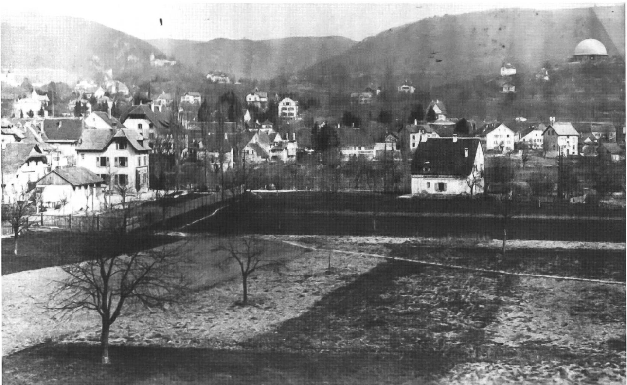
Abb. 3: Bruggfeld (Aesch) und Dornachbrugg im Winter 1918. Im Bruggfeld hatten Dornacher Bauern ihre Felder, die auf den steinigen Böden ziemlich karg, bezüglich der Begleitvegetation aber reichhaltig gewesen sein müssen. Erkennbar sind Kleinstrukturen wie ein «wilder» Weg (mitten durch die Felder), überständiges Kraut usw.

Welche Chancen haben die Ackerunkräuter in der heutigen Landschaft? Wegweisend ist ein Projekt der Gemeinde Arlesheim und des Kantons Basel-Landschaft, die in der Arlesheimer