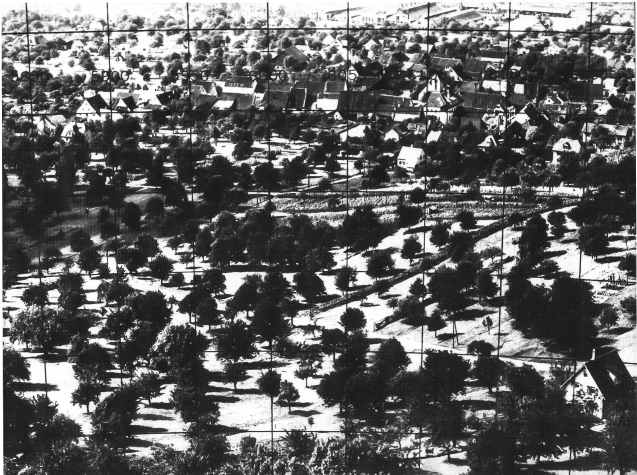
Abb. 9: Quidum und Oberdornach 1939. Einzelne Reste von Rebbergen im ehemaligen ausgedehnten Reb- gelände sind noch erkennbar. Sonst ist alles Rebland in Wiesen und Äcker umgewandelt und mit Hochstamm- obstbäumen bepflanzt worden. 1951 gab es in Dornach rund 19 000 Obstbäume.

eine artenreiche Gruppe (80% davon sind im Untersuchungsgebiet verschwunden oder gefährdet).