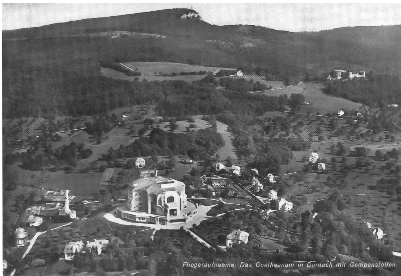
Fliegeraufnahme: Das Goetheanum in Dornach mit Gempenstollen

Abb. 21: Goetheanum und Umgebung 1931, Blick nach Osten. Im Hintergrund die Dornacher Allmende im Gebiet Bluthügel (Goben) und um das Dornacher Schloss. Gut sichtbar ist auf dem Bild der Unterschied zwischen dem Allmend- und stark parzellierten Privatland. Dem Allmendland fehlen weitgehend die Obstbäume, auch ist es zum grössten Teil extensiv genutzt. Auf den Magerweiden tritt eine äusserst fein modellierte Topographie hervor. Die auf Bergsturzmassen stockenden Gehölze auf dem Bluthügel und die Hecke auf der Allmende wurden 1944 gerodet. Im Hintergrund ist auf dem Schlangenbergli an der Feldstruktur das magere Mattland erkennbar. Das Goetheanum ist auf einem ehemaligen Rebhügel errichtet. Dazu waren stellenweise grössere Terrainveränderungen nötig.