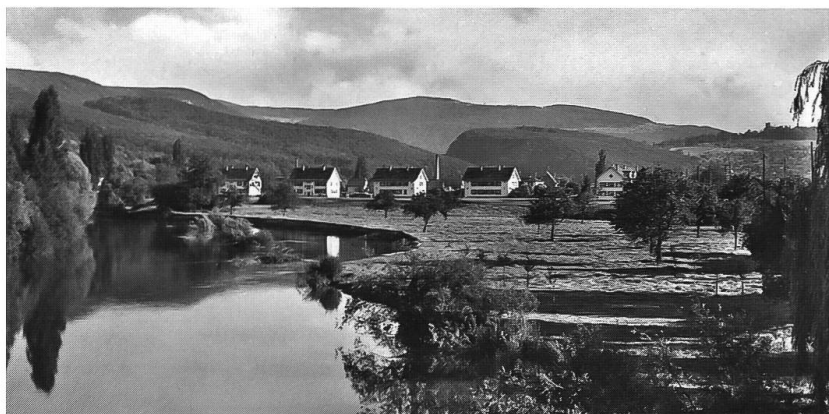
Abb. 14: Birs bei Dornachbrugg um 1920, Blick gegen Süden. Auf Baselbieter Seite noch weitgehend unbefestigtes Ufer. Zur Zeit der Aufnahme vermutlich gerade ein mittleres Hochwasser. Teile der Wiesen sind überschwemmt.