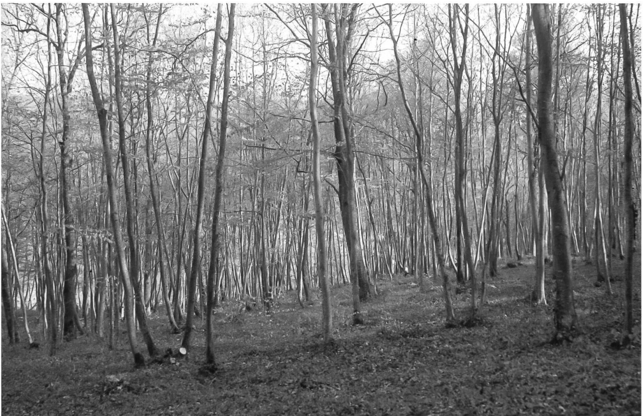
Abb. 42: Gstüd in Arlesheim 1925. Auswachsener Mittelwald. Hauschicht und Überhälter sind schon etwa gleich hoch. Kniehohe, dichte Buchenverjüngung. Der (noch) lichte Mittelwald bot verschiedenen relativ lichtbedürftigen Waldpflanzen Lebensraum, hier z.B. dem Wunderveilchen.