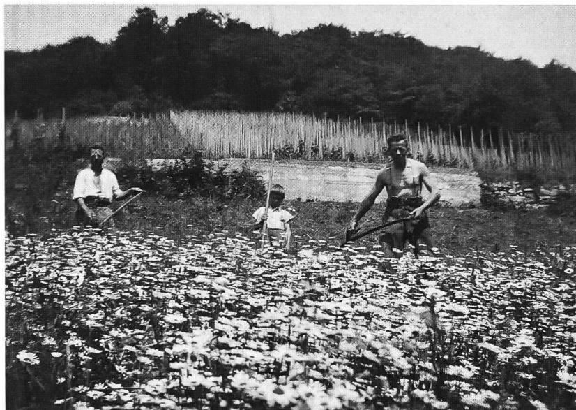
Abb. 28: Arlesheim unterhalb Rebberg, um 1920. Fettwiese, wo bis vor kurzem noch ein Rebberg bestand. Auf neuen Fettwiesen konnten Margeriten, wie hier, Massenbestände bilden.