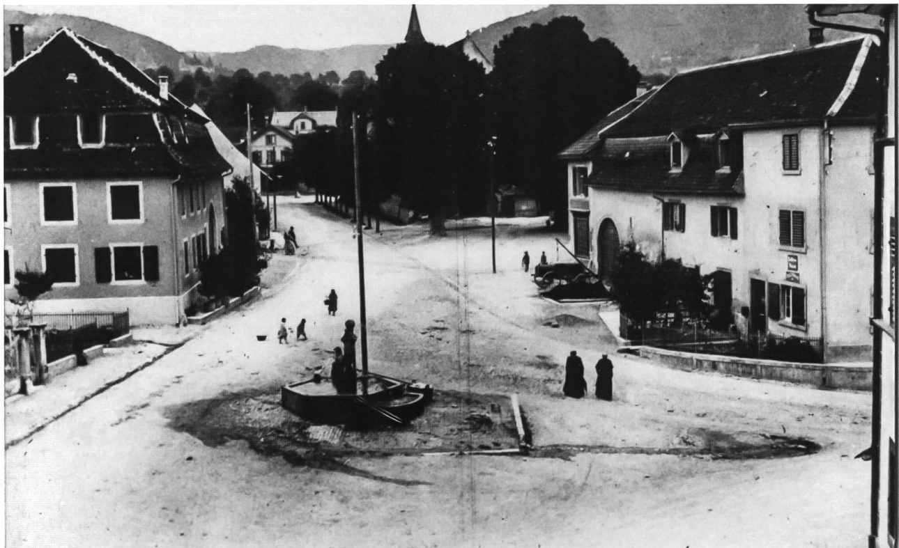
Abb. 36: Dorfplatz von Dornachbrugg 1900. Das Dorf hatte 1874 durch den Bau der Bahn, des im Hintergrund sichtbaren Bahnhofs und der Zufahrtstrasse einige Veränderung erfahren. Auf dem Bild erscheint die Siedlung mit ihren gepflegten Hausgärten trotz Misthaufen, Jauchefass und Dung auf den Strassen recht herausgeputzt. Es sind keine Ruderalfluren sichtbar. Die Mergelbeläge der Strassen, Gehsteige und Plätze, auch das Pflaster in den Strassengraben und um den Brunnen sind stellenweise mit Trittfluren bewachsen, vor allem an den bewässerten Stellen wie im Strassengraben links, um den Brunnen und in der Ablaufrinne.