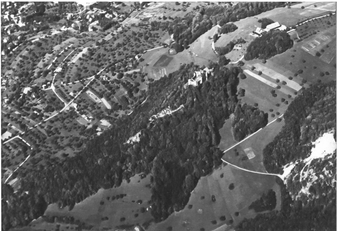
Abb. 23: Wüste Reben, Ramstel, Dornacher Schloss 1948. In der Anbauschlacht wurden an vielen Orten, auch im extensiv genutzten Wiesland, Äcker angelegt. Auf den extensiv genutzten Wiesen wachsen, wo Felsen aus dem Boden ragen, Gebüsch. Gut erkennbar sind die Krautsäume entlang der Waldränder. Diese sind teilweise, vor allem auf unproduktiven Standorten, wo stark parzellierte Wiesen angrenzen, «gebuchtet». Der Steinbruch rechts (Fuchsloch) wurde später grösstenteils wieder aufgefüllt und mit Bäumen rekultiviert.

Wie liesse sich die Situation für die Saumpflanzen verbessern? Im Landwirtschaftsgebiet wirkt die Erhaltung von Säumen und gebuchteten