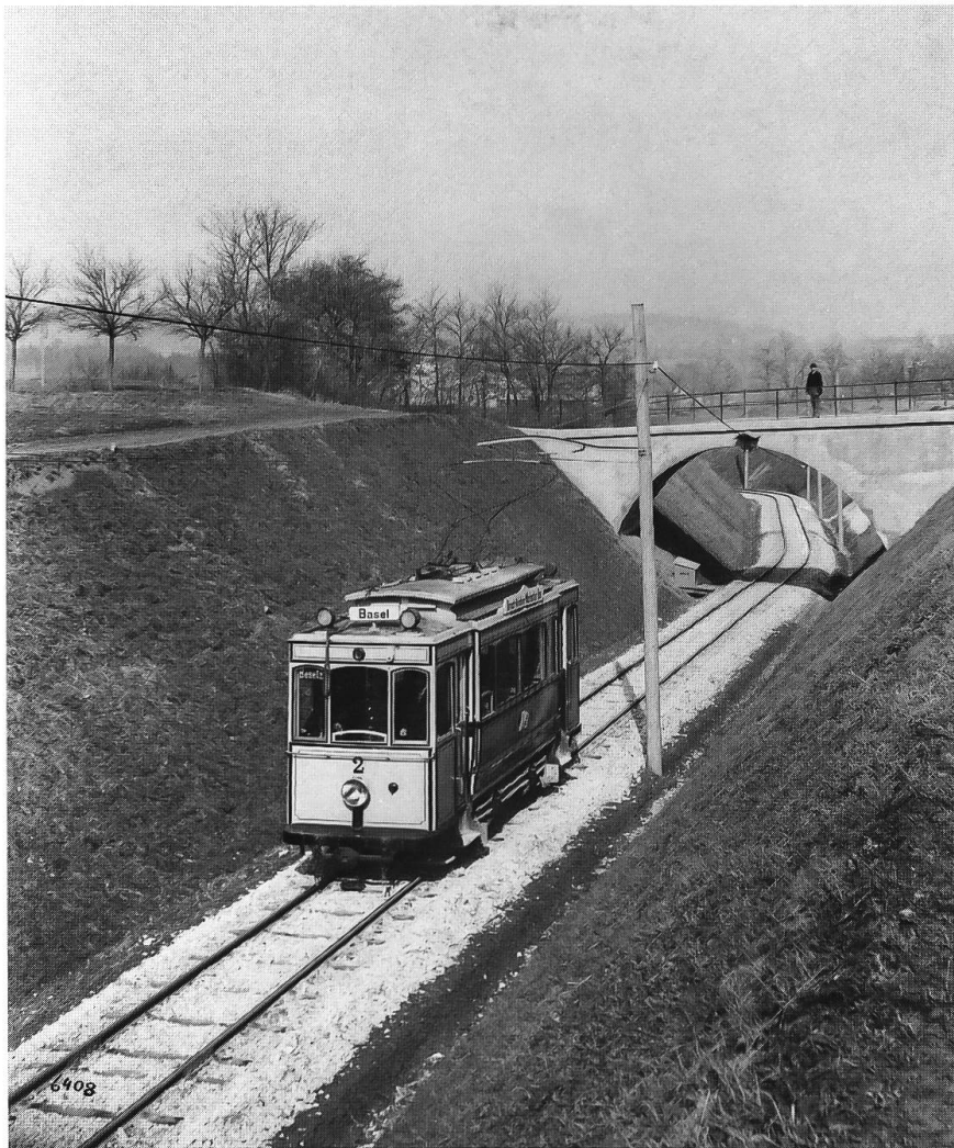
Abb. 40: Die 1902 erbaute Tramlinie nach Arlesheim bei Hofmatt, um 1920. Die Linie steigt zuerst in einem natürlichen Graben, dann in einem künstlichen Einschnitt in der Niederterrasse auf. Die steilen Dämme wurden nach der Abgrabung mit (magerem Humus) bedeckt und begrast. Auf dem Bild sind sie sorgsam gemäht, an den Dammoberkanten sind Erdanrisse, Lebensraum trockenheitsliebender Vegetation (Mauerpfefferfluren), erkennbar.