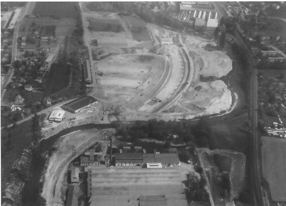
Abb. 39: Birskorrektur von 1971 nördlich der Metallwerke (Luftaufnahme). Die Birs wird in ein neues begradigtes Bett verlegt. Man versuchte mit einer landschaftsarchitektonischen Begleitplanung das Projekt einigermaßen naturverträglich zu gestalten. «Nach Fertigstellung des Bauwerkes ging es darum, die harten technischen Zäsuren zu mildern und durch gezielte grünplanerische Mittel wieder einen naturnahen Landschaftsraum aufzubauen...» (Wiede 1974).