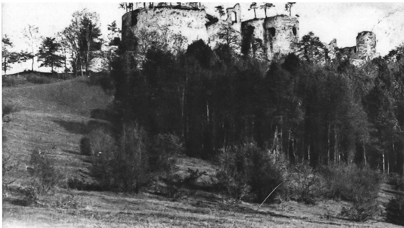
Abb. 12: Allmendweide westlich der Ruine Dorneck, 1899. Auf der mageren Weide wachsen vom Waldrand her Zitterpappeln und Gebüsche auf. Auch flache Lagen wurden – wie das Bild zeigt – völlig extensiv genutzt, durch den Allmendstatus vor einer Intensivierung bewahrt. Die Waldfläche um die Ruine hat seither deutlich zugenommen.