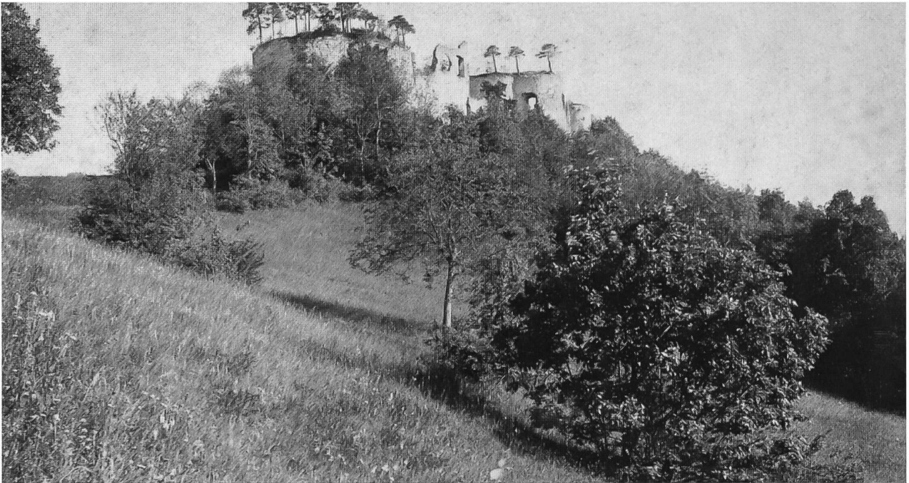
Abb. 10: Allmend um die Ruine Dorneck um 1880. Im Vordergrund artenreiche Magerweide für Ziegen mit Büschen und jungem Nussbaum.