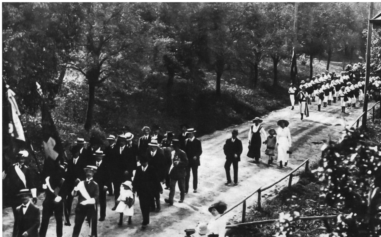
Abb. 25: Bruggweg (Dornach) 1923. Umzug anlässlich der Schlachtfeier, die jeweils im Juli abgehalten wurde. Unter den extrem dicht stehenden Obstbäumen (Zwetschgen) steht das Gras hoch, wahrscheinlich der zweite Aufwuchs, mit z.T. viel Doldenblütlern, was die Folge von einseitiger Güllendüngung sein konnte.

wirtschaftet werden, wofür es etliche Beispiele gibt. Auf öffentlichen Flächen sind auch Mischtypen Fettwiese – Scherrasen möglich: Erst ab ca. Mitte Mai geschnittene, im Frühling blumenreiche Rasen, die später im Jahr regelmässig geschnitten werden und betreten werden können.