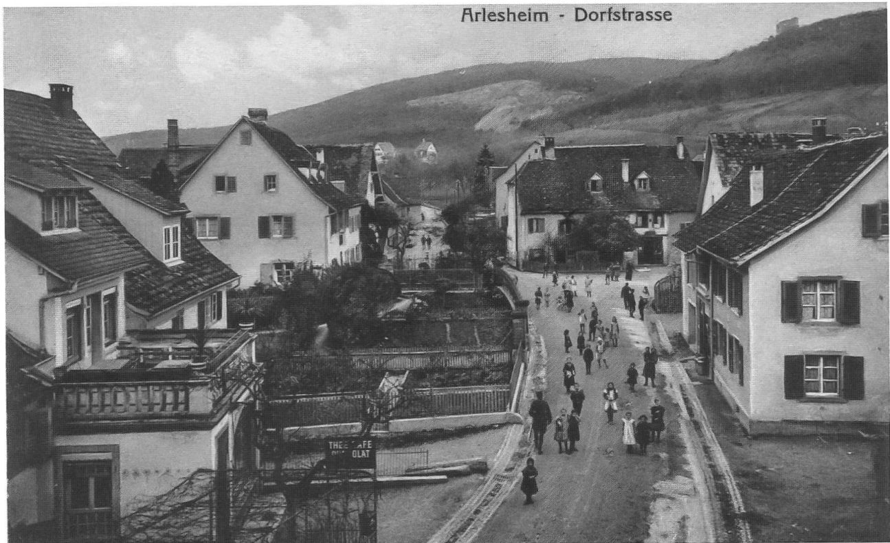
Abb. 34: Dorfstrasse Arlesheim um 1900. Die der Strasse zugewandten Seiten der Häuser, die Bauerngärten und Gehsteige sind recht repräsentativ. Ruderalfluren kamen eher in wenig betretenen Ecken, entlang von Hausmauern oder in den Hinterhöfen vor. Im Hintergrund am Waldhang der Steinbruch mit Abraumhalde.