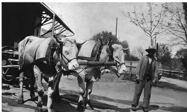
Abb. 24: Arlesheim, um 1900. Ochsengespann vor dem Güllewagen. Transporte von Lasten, wie beispielsweise Gülle, waren eine mühsame Angelegenheit. Der Intensivierung des Wiesenbaus waren aus technischen Gründen enge Grenzen gesetzt.

Damit sind auch schon die Chancen der traditionellen Fettwiesen angesprochen. Von den Förderprogrammen kann mittel- bis langfristig in den nächsten 5–10 Jahren einiges erwartet werden. Teilweise wird in den Förderprogrammen und -Projekten auch der Feldobstbau unterstützt. In grösseren Gärten und Parks können wenig betretene Flächen als blumenreiche Fettwiesen be-