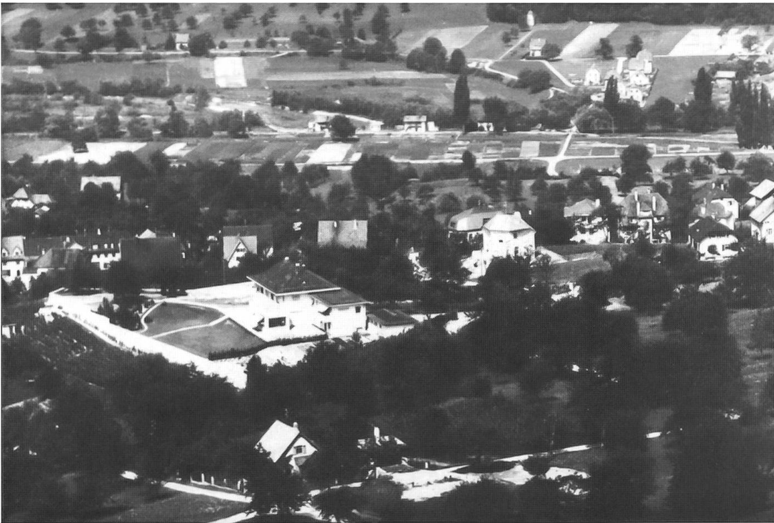
Abb. 6: Muren (Dornach) 1936. Blick gegen die Birsebene. Anstelle der früheren Rebberge entstehen Villen. In der Birsebene sind die «Widenstückli», kleine Äckerchen und Gemüsefelder auf Bürgergemeindeland (Bündten) und das Heideland in der verbliebenen Birsschlaufe, wo Ziegen geweidet wurden, sichtbar.