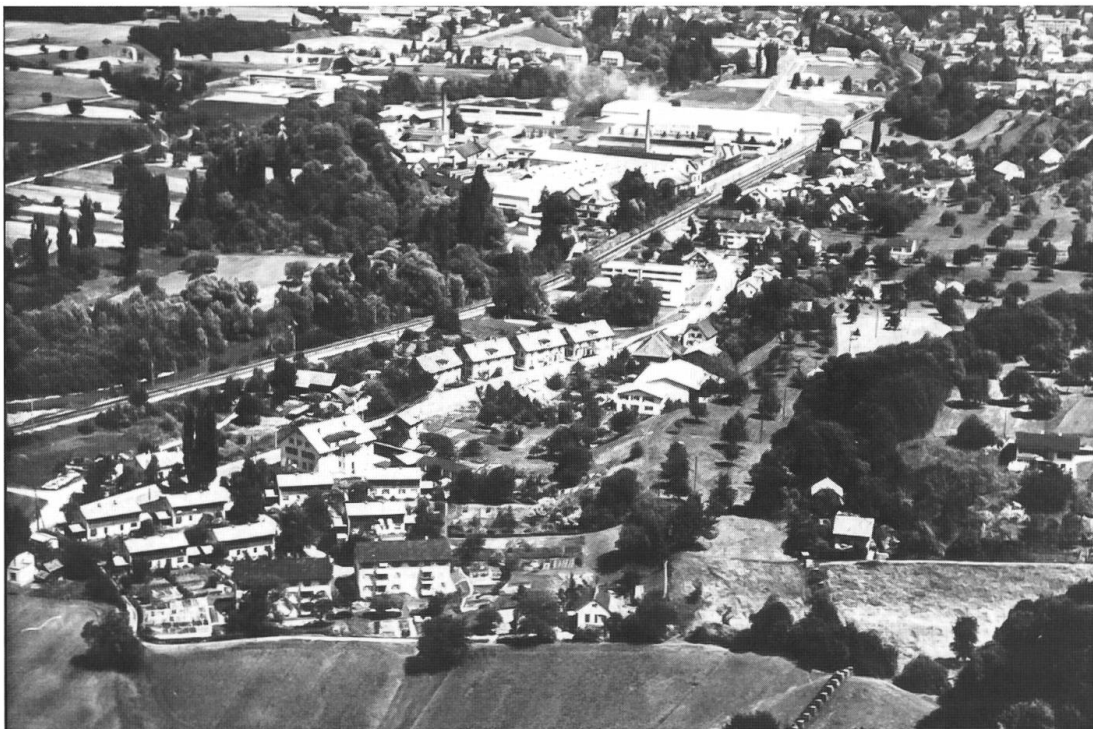
Abb. 7: Apfelsee und Metallwerke (Dornach) 1964. In der Arbeitersiedlung der Metallwerke (Neue Heimat) haben sich bis heute Elemente der traditionellen Kulturlandschaft (Arten, Biotope) erhalten. Im Vordergrund Getreidefelder mit Spritzgassen. An der Birs, die noch in ihrem alten Bett fliesst, gibt es noch Restflächen von Auenwald (Begradigung 1971).