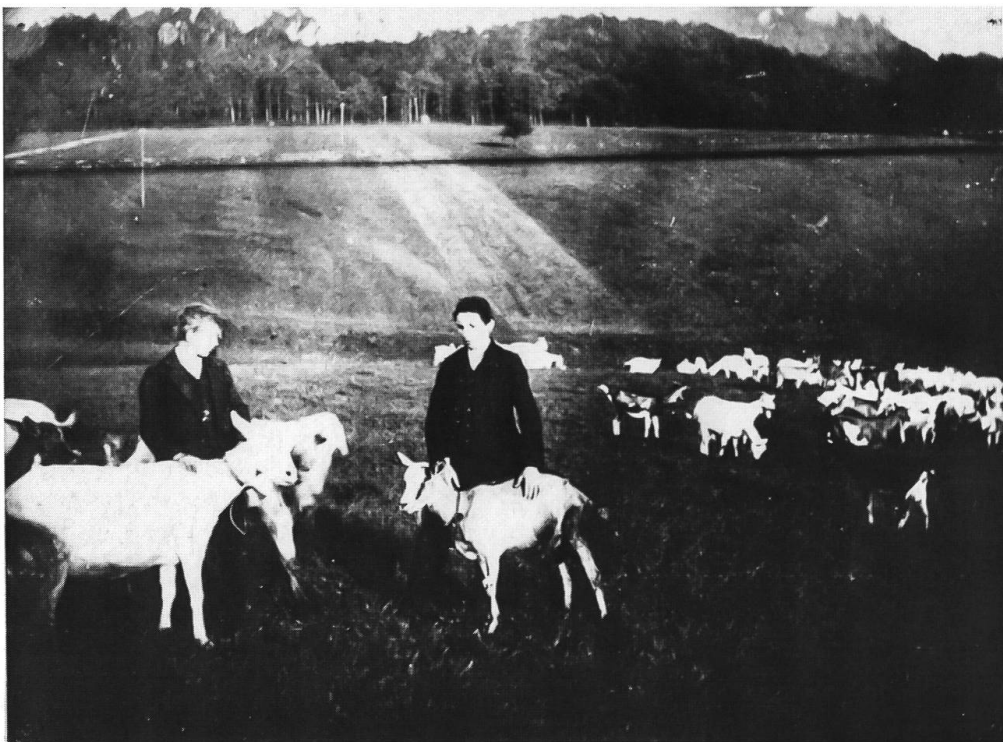
Abb. 11: Allmendweide nördlich vom Dornacher Schloss, 1912. Die Dorfziegenherde wird noch von Kindern gehütet. Im Jahr darauf subventionierte der Kanton der Ziegenzuchtgenossenschaft Dornach auf der Allmend einen Zaun. Womöglich handelte es sich beim Rasen im Vordergrund um ein Orchis morionis -Mesobrometum, das normalerweise gemäht wurde. Vielleicht – nach den Wollkitteln der Kinder zu schliessen – ist das nur die Herbstweide. Im Hintergrund am Gegenhang sind die privat als Heumatten genutzten Stücke des Allmendlands (Schlangenbergli) zu erkennen. Diese waren bis zur Melioration, 1944, ausserordentlich vielfältig und artenreich.