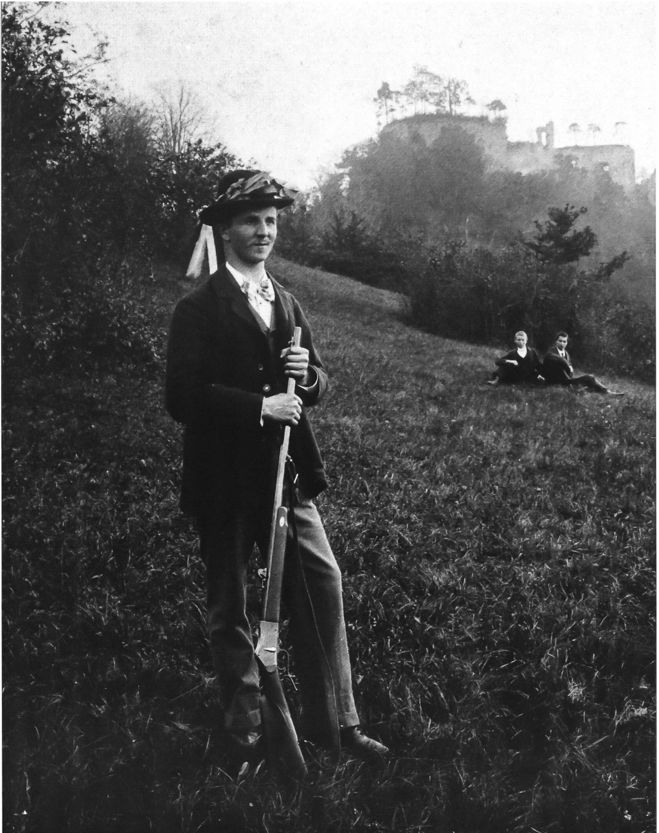
Abb. 22: Buschbestandene Ziegenweide vor der Ruine Dorneck, 1907 (Allmend). Gemäss den Literaturangaben waren diese Magerweiden sehr artenreich. Der herbstliche Weidrasen zwischen den rundgefressenen Büschen, auf dem der Schütze posiert, ist auffallend homogen. Es gibt keine Gebüschsäume.