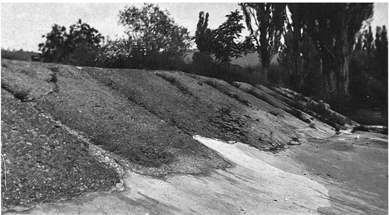
Abb. 32: Dornachbrugg um 1900. Neu geschütteter Damm kurz nach der Korrektur. Der Damm ist im unteren Teil mit einer Pflasterschicht befestigt, im oberen humusiert und noch kaum bewachsen (im Projekt war eine Begrasung vorgesehen). Die Humusierung ist vom Regen z.T. wieder wegerodiert. Auf solchen Dämmen, wie sie um die Jahrhundertwende zahlreich entstanden, konnten sich grossflächig Ruderalgesellschaften ausbreiten.