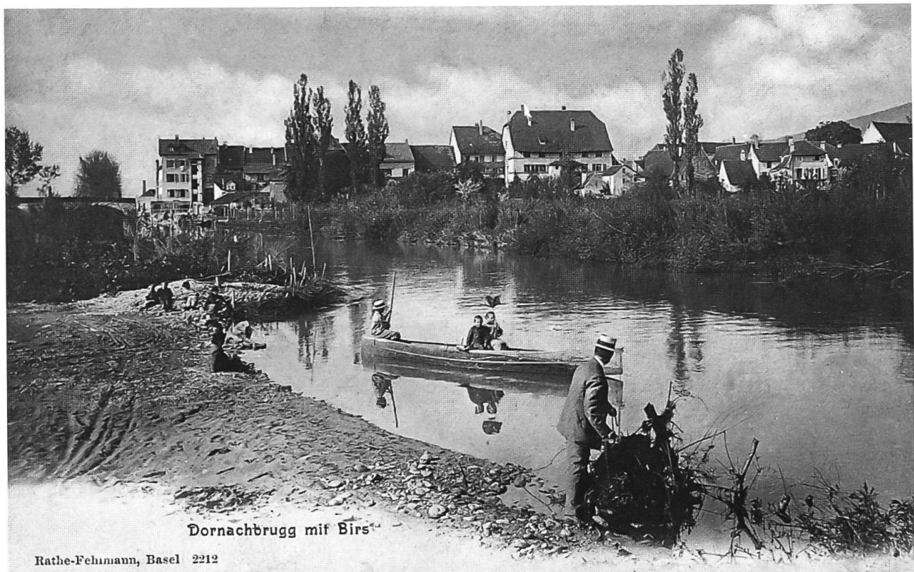
Abb. 17: Birs bei Dornachbrugg um 1900, kurz vor der Korrektur. Im Vordergrund trockengefallene Schlamm- und Sandflächen, die im Hochsommer von Zweizahnfluren ( Bidention ) bewachsen sein konnten.