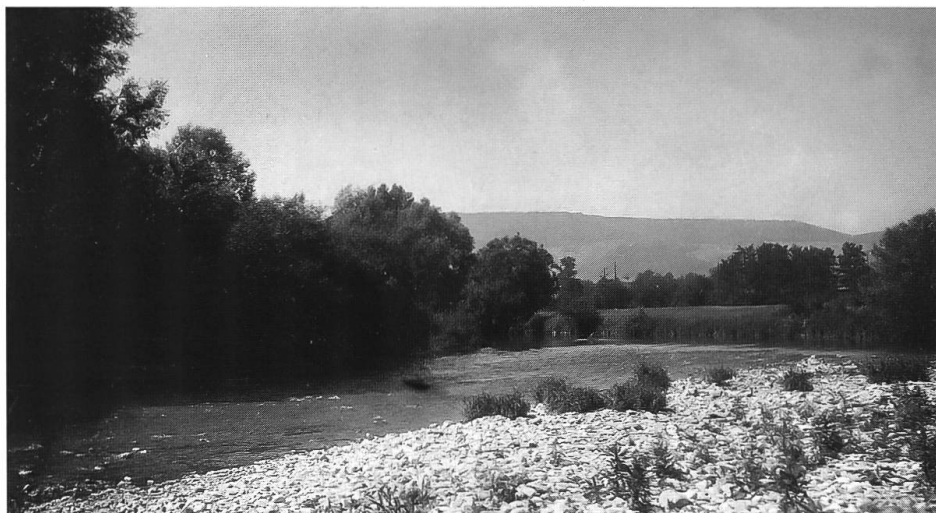
Abb. 37: Birs bei Dornachbrugg, Blick gegen Süden, um 1930. Trockengefallene Kiesinsel, mit hochsommerlicher Krautflur bewachsen: Infolge der nur noch kurzen Zeit des Trockenfallens und der zunehmend schlechten Wasserqualität vor allem mit Arten der Knöterich-Hackfruchtbegleiter ( Polygono-Chenopodion ).

parkplatz der Gasverbund Mittelland AG, auf dem Acinus arvensis (Ackersteinquendel) und Petrorhagia prolifera (Sprossende Felsennelke) gedeihen. Unversiegelte Parkplätze sind demnach eine gute Möglichkeit dafür, ebenso Flachdächer, die z.B. mit Birsschotter bedeckt werden. Man sollte dann allerdings auf eine Intensiv- Sedum -Bepflanzung verzichten und auf die spontane Besiedlung warten können. Weiden mit flachgründigen Böden sollten extensiviert, weniger stark bestossen und nicht mehr gedüngt werden. Wie oben schon erwähnt, sind Steine, Bruchsteinmauern und Blockwurf ein wichtiges Gestaltungselement in der Siedlung geworden. Meist sind sie jedoch mit südeuropäischen Polsterpflanzen bepflanzt und bieten oft wenig bis keinen Raum für eine Spontanvegetation. Durch die Umstellung im Unterhalt der Bahntrassen und Strassenränder – auf trockenen Böden sollte erst im Hochsommer oder Herbst gemäht werden – könnten Pflanzen der Trockenstandorte wirkungsvoll gefördert werden. Auf den Birsdämmen könnte man sich gut lichte Pionierobstgehölze auf kiesig-schotterigen Böden vorstellen. Man sollte dieses Ziel langfristig anvisieren, um bei Sanierungen der Dämme und von Leitungen in diese Richtung vorgehen zu können. Für die Birsschotterfluren liesse sich nur durch grössere Auenrenaturierungen Raum schaffen, was unter den gegebenen Verhältnissen kaum in Betracht kommt.