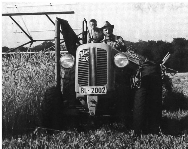
Abb. 4: Arlesheim, «in den Weiden», um 1930. Getreideernte mit dem Bindmäher. Schon recht intensiver Getreidebau in der ehemaligen Birsau. Die früheren Schotterböden sind zu diesem Zweck grossflächig mit Lehmerde überdeckt worden.

Birsebene im Bereich einer Grundwasserschutzzone ein ca. 15 ha grosses Ackerreservat eingerichtet haben, wo bewusst ein extensiver Acker-