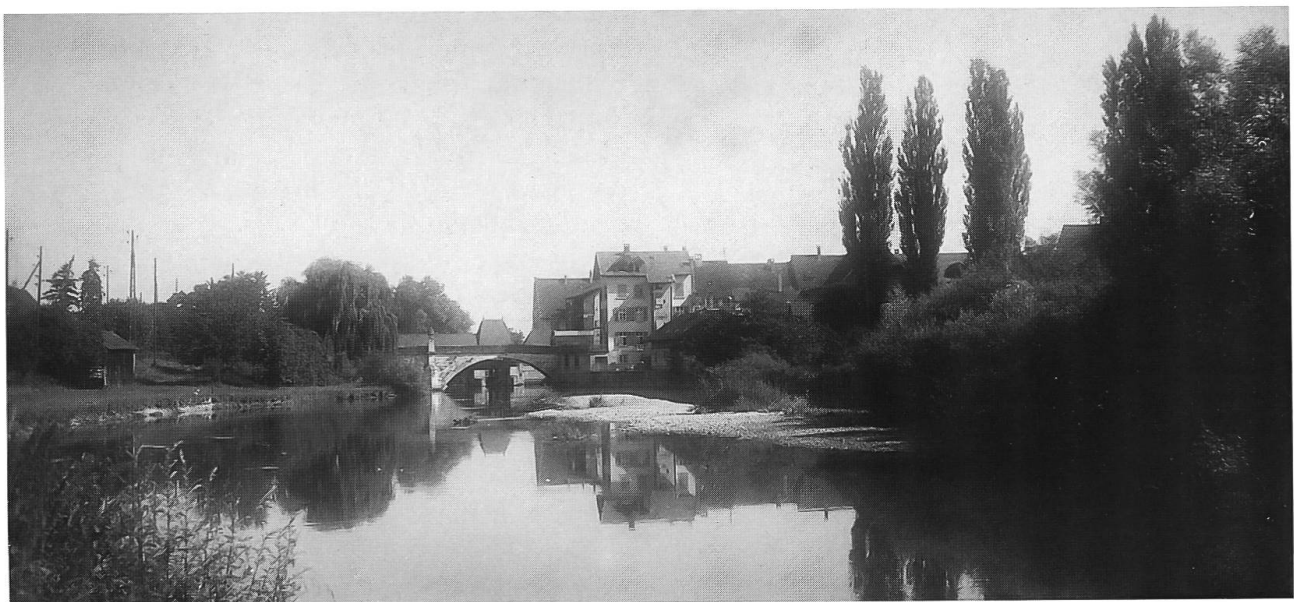
Abb. 18: Einseitig verbaute Birs bei Dornachbrugg um 1930. Blick gegen Norden, gegen die Nepomukbrücke. Im Hintergrund das 1924 erbaute Wehr. Der 1900 erstellte Damm auf Dornacher Seite ist weitgehend mit Weidenbüsch eingewachsen. Da die Birs auf Baselbieter Seite noch genügend Platz hat, können sich dennoch typische Auenlebensräume ausbilden: Trockengefallene Kiesinseln, teilweise mit Schlammflächen, Erosionsrand am unverbauten Ufer etc.