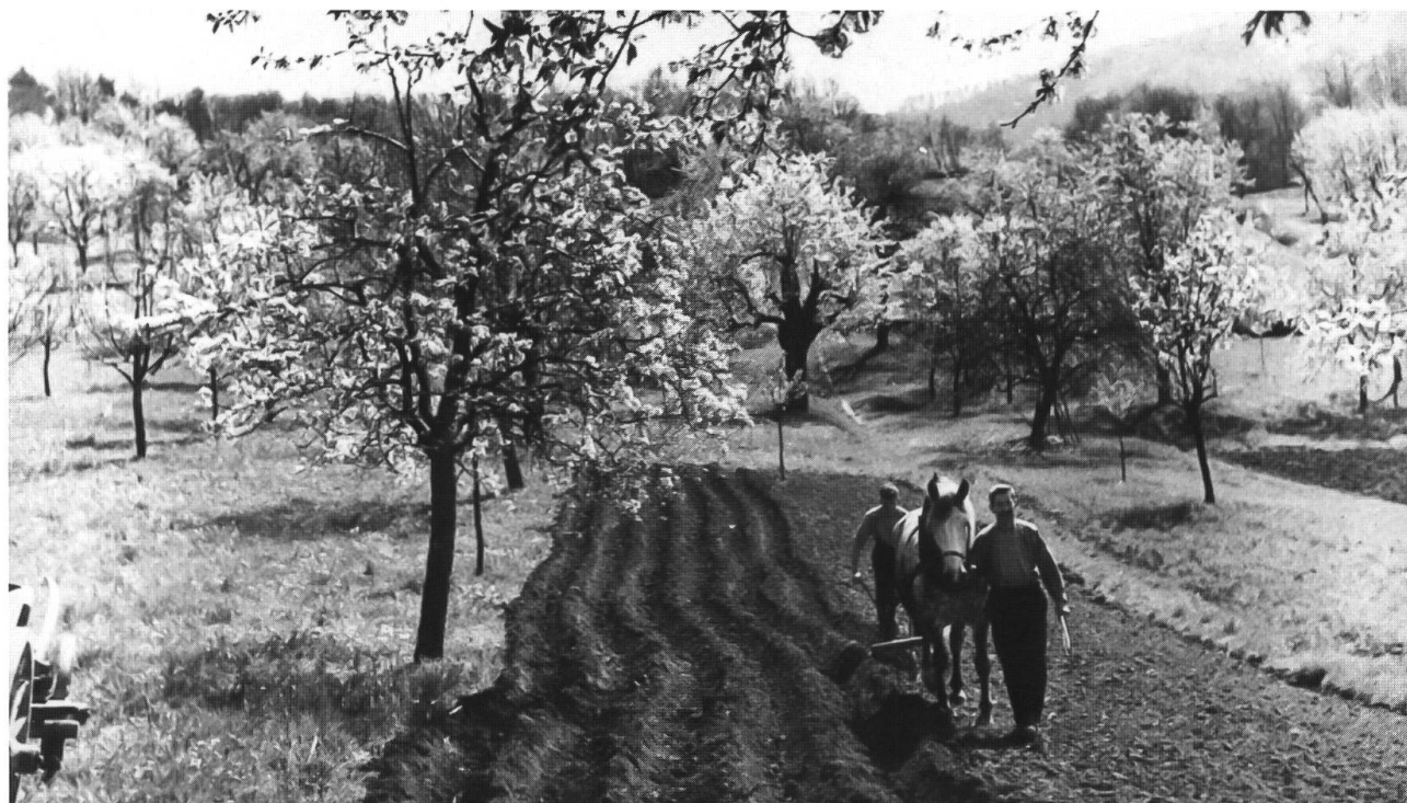
Abb. 5: Quidum (Dornach) 1964: Im Kartoffelbau wurde noch lange der altertümliche Beetpflug verwendet. Vor der Einführung des Wendepflugs war dies auch im Getreidebau die gängige Pflugform. Womöglich wurde die Wiese gerade frisch umgebrochen. Andeutungsweise sind Wölbäckerstrukturen, Gewölbe und Furchen, Zeugen früheren Ackerbaus zu erkennen.

bau betrieben wird. Gefährdete Arten wie der Feldrittersporn oder die Stengelumfassende Taubnessel und viele andere Ackerpflanzen überdauern seit Jahren in diesen Äckern. Es wäre wünschenswert, wenn auch in anderen Quell- und Grundwasserschutzzonen in der Ebene solche Ackerreservate angelegt würden. Bei den Förderprogrammen von Bund und Kantonen dürften, wie das Beispiel der Arlesheimer Widen zeigt, vor allem Spontanbrachen oder ein extensiver Getreidebau, dort wo gewisse Arten des traditionellen Ackerbaus noch auflaufen, erfolgversprechend sein. Die vom Bund subventionierte sechsjährige Buntbrache bringt vor allem in den ersten zwei Jahren für die Segetalflora etwas. Das Folgestadium entspricht keinem Vegetationsbild der traditionellen Landschaft. Auch sind nicht alle der eingesäten Arten Bestandteil der früheren Flora. Möglicherweise können mit den neu eingeführten Typen, Wanderbrache und Rotationsbrache, bessere Erfahrungen gemacht werden.