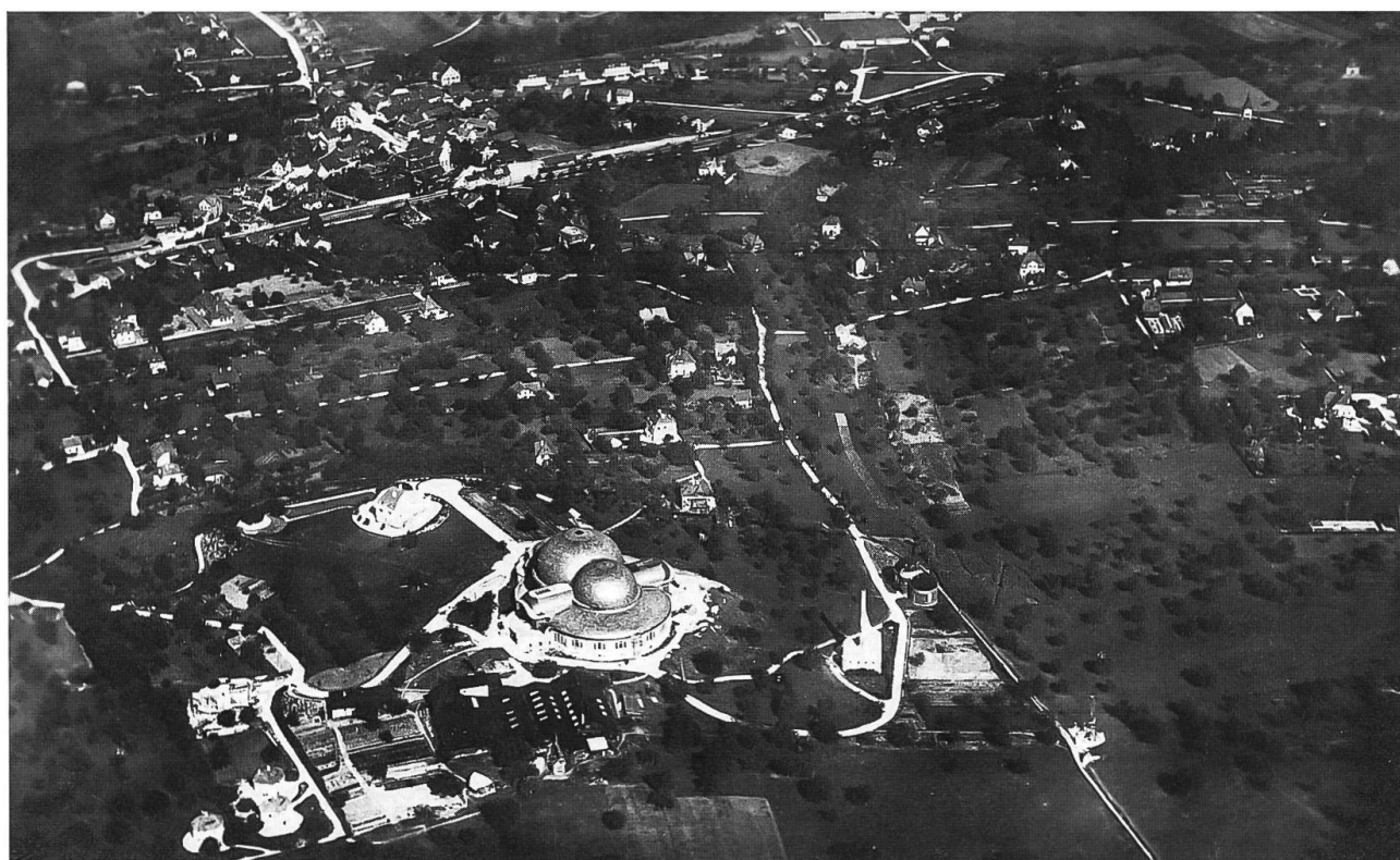
Abb. 16: Goetheanumgelände mit Schwinbach zwischen Dornach und Arlesheim um 1915. Der Bach fließt noch weitgehend durch offenes Wiesland. Die Wiesen der flach geneigten Bacheinhänge waren grösstenteils recht feucht. Rechts vom Glashaus, auf der rechten Seite des Bachs eine traditionell genutzte Streuefläche mit hochwüchsigem Seggenbewuchs und Wassergräben, letzter Rest der ehemals ausgedehnten Wässermatten entlang des Schwinbachs. Die Aufnahme verdeutlicht auch die zu dieser Zeit rege Bautätigkeit.

Die Gruppe der Wasserpflanzen umfasst im Untersuchungsgebiet 41 nachgewiesene Arten, von