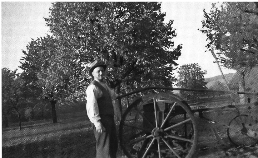
Abb. 27: Arlesheim um 1930. Gepflegter Streuobstbestand und Fettwiesen. Die Sämaschine wurde wohl zum Ausbringen von Kunstdünger gebraucht.