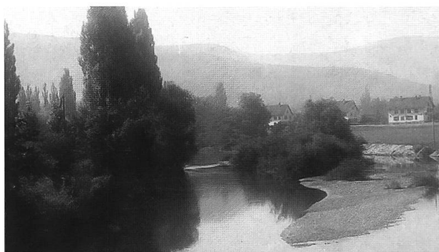
Abb. 20: Birs bei Dornachbrugg um 1930. Blick gegen Süden. Weitgehend unverbautes Baselbieter Ufer, Kiesbank und Weidengebüsch im Fluss. An den Erdanrissen am Ufer konnten sich spezielle Pflanzengesellschaften, v.a. Straussgras-Kriechrasen ( Agropyro-Rumicion ), ansiedeln.

Die Anlage neuer Gebüsch- und Hecken ist im untersuchten Gebiet demnach keine prioritäre Aufgabe für den Arten- und Biotopschutz. Gebüsch- und Hecken machen vor allem dann Sinn, wenn sie mit anderen Massnahmen kombiniert sind: Zum Beispiel mit der Ausdöhlung von Bächen oder der Einrichtung von Magerweiden. Auch sollte man den Mut haben, bestehende Hecken und Gebüsch- und Hecken sporadisch auf Stock zu setzen, so z.B. die Gehölzbestockung entlang der Bäche. Wo der Gewässerunterhalt nicht ohnehin den Gemeinden obliegt, sollten diese die privaten Grundeigentümer bei dieser Aufgabe unterstützen.