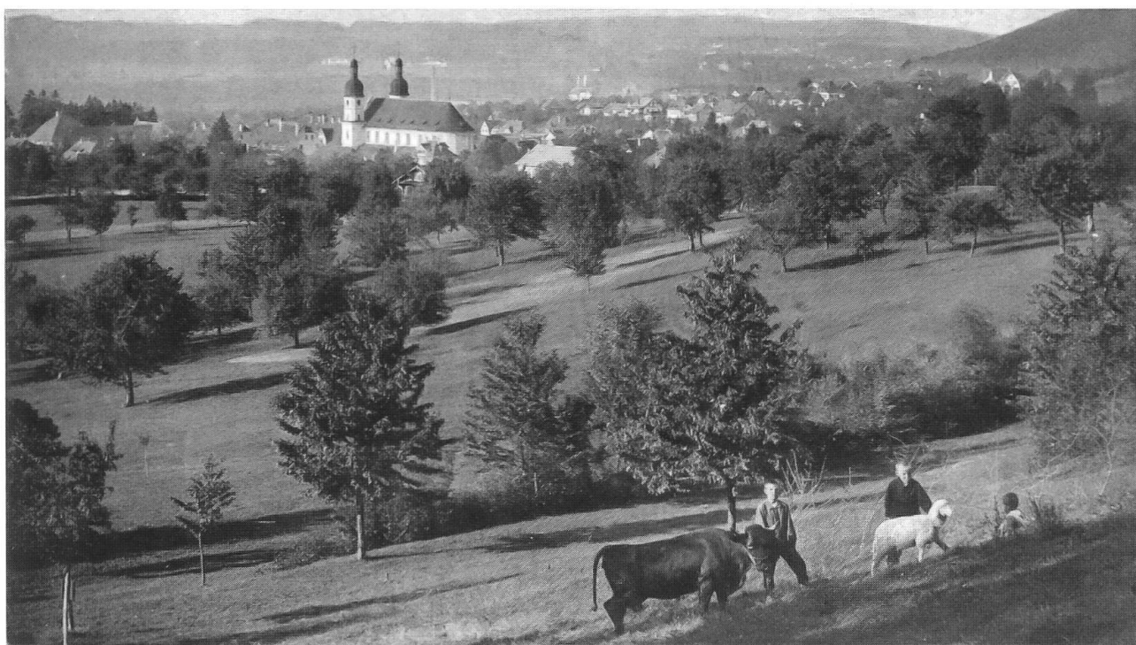
Abb. 13: Finkeler (heute Quellenweg in Arlesheim), ca. 1920, Blick gegen das Dorf Arlesheim. Im Vordergrund Vieh hütende Kinder (Herbstweide?). Dahinter ein Ackerrain mit Gebüsch, Strukturen, die auf keinen Plänen eingetragen sind.