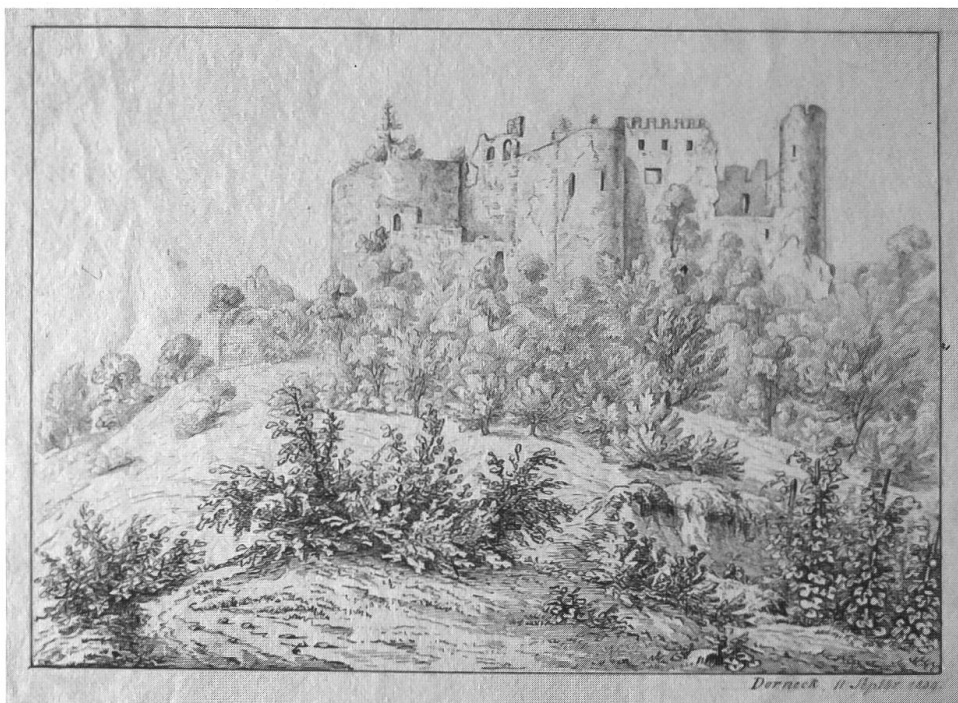
Abb. 8: Rebberg vor der Ruine Dorneck 1839. Stich von J.F. Walter. Die Distanz zwischen der Ruine und dem oberen Rand der Rebberge ist etwas idealisierend verkürzt. Leicht verschiedene Ansichten sind zu einem Bild kombiniert. Die Situation entspricht jedoch noch weitgehend derjenigen von 1880. Im Vordergrund der Übergang vom Rebberg zur buschbestandenen Magerweide mit Erdanrissen und steinigem Weg. Diese Details waren nicht bloss pittoreske Bildelemente, sondern Lebensräume von Pionierpflanzen wie Deutschem Enzian oder Gemeinem Steinkraut.

Die Gruppe der Magerwiesenpflanzen ist in der Literatur seit Lachenal (1759) für das Untersuchungsgebiet gut dokumentiert. Von den Botanikern oft besuchte Orte waren die Ränggersmatt und das Dornacher Schloss. Die Magerrasenpflanzen sind mit 145 nachgewiesenen Arten