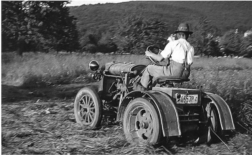
Abb. 26: Arlesheim um 1920. Das damals neuste Traktormodell. Mähen der Fettwiesen mit angehängtem Mähbalken.