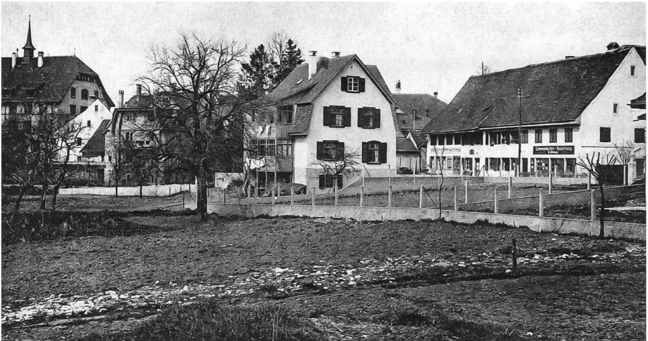
Abb. 31: Birsvorland (Bodenmatt oder Kanzleimatt) bei Dornachbrugg um 1900. Das Dorf befindet sich, leicht erhöht, geschützt vor Hochwassern, auf einem Felsriegel der Elsässer Molasse. Die neuen Gärten werden mit Betonmäuerchen vor Hochwassern geschützt. Das tiefliegende Land war ehemals eine Wässerematte. Undeutlich sind verschiedene Strukturen darin erkennbar: Obstbaum, Steinhäufen, schotterige Bodenstellen, steiniger Weg?, überständiges Kraut usw.