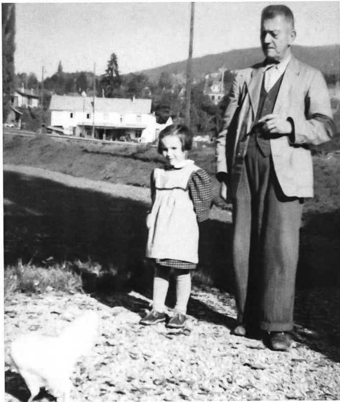
Abb. 33: Dämme «in den Weiden», Dornach, ca. 1910. Damm mit Zubringer zum neuen Turbinenhaus, im Hintergrund Damm mit Zubringergleis zu den Metallwerken. Anstelle des Auenwaldes gibt es nun Äcker. Das ganze Terrain ist heute bis auf die Höhe der Dammkronen angehoben und mit Lagerhallen überbaut.