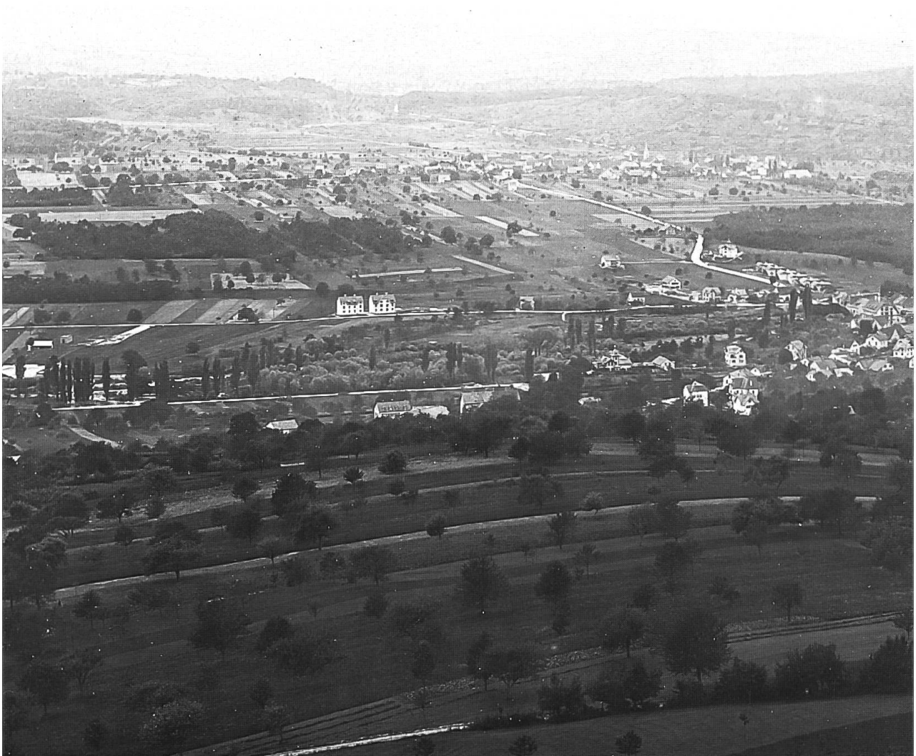
Abb. 29: Blick über die sanft gewellten Abhänge von Dornach, vor 1900. Blick gegen die Birsebene und das Bruderholz. Aufnahme wohl zur Zeit des Emds (August), da nirgends Leitern angestellt sind. Verschiedene Wiesen sind gerade gemäht worden. Im Vordergrund das Gebiet Erli mit seinen streifenförmigen, quer zur Hang-

Chenopodium bonus-henricus (Guter Heinrich): Dornach hie und da.