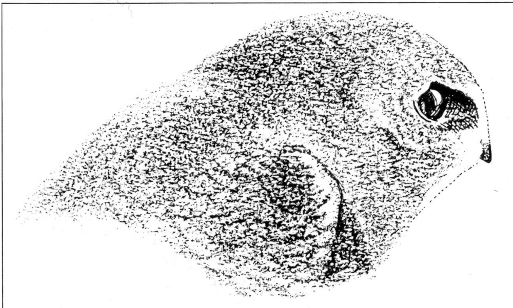
Abb. 3: Ausgewachsener Jungvogel; Ansicht schräg von hinten; siehe Text.