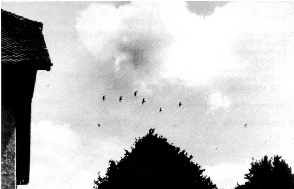
Abb. 1: Eine in ferner Höhe jubilierende Seglergruppe über der Landschaft von Oltingen, BL, Schweiz.

Und schöne, weisse Wolken ziehn dahin durchs tiefe Blau, wie schöne stille Träume; – mir ist, als ob ich längst gestorben bin, und ziehe selig mit durch ew'ge Räume.