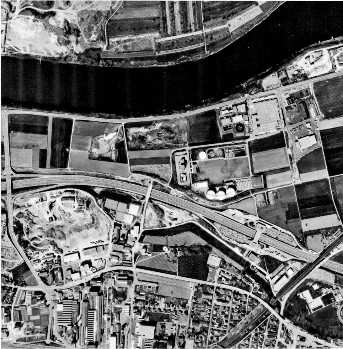
Luftaufnahme. Reproduziert mit Bewilligung des Kant. Vermessungsamtes Baselland vom 22.8.1988.

aufnahme und der Abbildung 1 ersichtlich ist, liegen die Kiesgruben in der Pratteler Rheinebene isoliert von ähnlichen naturnahen Biotopen. Als grösster zusammenhängender, nicht stark genutzter Lebensraum muss das bewaldete Rheinbord erwähnt werden. Dieser Prallhang hat aber durch die Aufstauung des Rheins und die Eingriffe im Uferbereich seinen ursprünglichen Charakter verloren. Weiter finden wir entlang der Autobahn grössere Schotterflächen, die durch Humusabtrag beim Bau der Nationalstrasse entstanden sind. Diese Ödflächen zeigen mit ihrer wärmeliebenden und Trockenheit ertragenden Pioniervegetation Ähnlichkeiten zu den entsprechenden Flächen der Gruben. Dieser Streifen misst an seiner grössten Breite allerdings