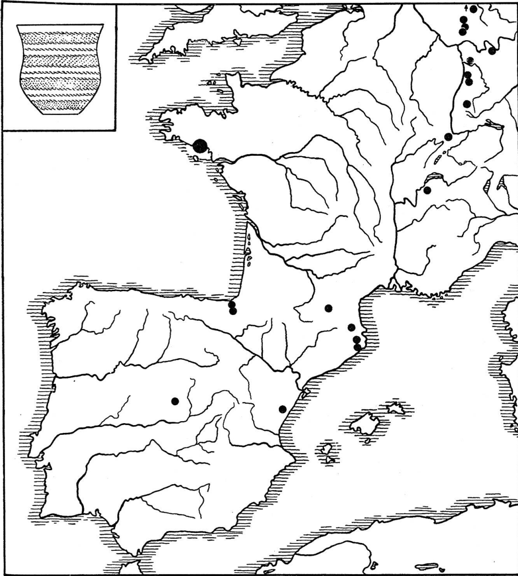
Karte. Verbreitung der Glockenbecher mit schnurgefassten Schrägstempelzonen.

zogen werden, wobei lediglich eine mittlere Schnur noch die ursprüngliche Trennung der Zonen versinnbildlicht. Gute Beispiele der letzteren Art bilden einmal der Becher von Huttenheim (Kreis Bruchsal) 4) , dessen