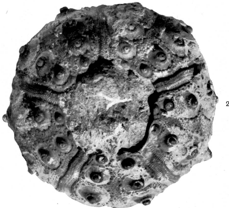
Rhabdocidaris Orbignyi , Agassiz. Fig. 1 von Seite, Fig. 2 von unten, \frac{7}{8} nat. Gr. Steinbruch Mellikon.