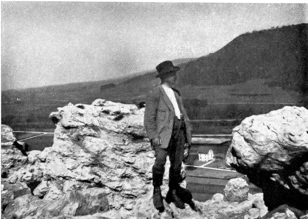
Steinbruch von Mellikon. Verkarstete oberste Malmschichten.

Die über den wohlgeschichteten Kalken liegenden glaukonitführenden (6) Schichten mit ihrer reichen Spongien- und Brachiopodenfauna gehören dem untern Kimmeridge an (= Crussolien Rollier = Badenerschichten Moesch. = Tenilobatusschichten, Oppel = Weisser Jura \gamma Quenstedt). Sie sind weniger gut gebankt und viel tonhaltiger als die Wangenerschichten.