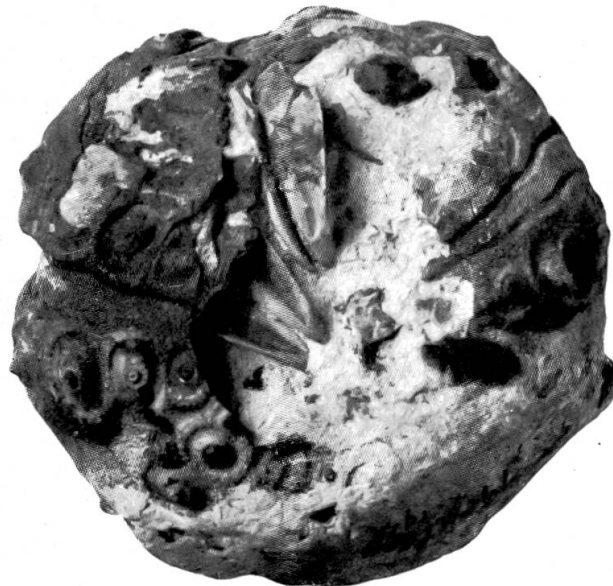
Rhabdocidaris nobilis, Münster mit Gebiss, 7/8. Steinbruch Mellikon, oberster Horizont. Sammlung Leuthardt.