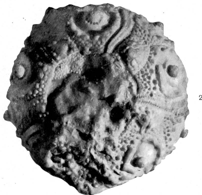
Fig. 1. Cidaris Parandleri Ag. von oben. Nat. Grösse.