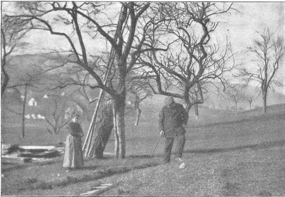
Eine aufgestaute Erdwelle.

Erdschlipf am Murenberg, oberhalb Hof Weidli, bei Bubendorf.