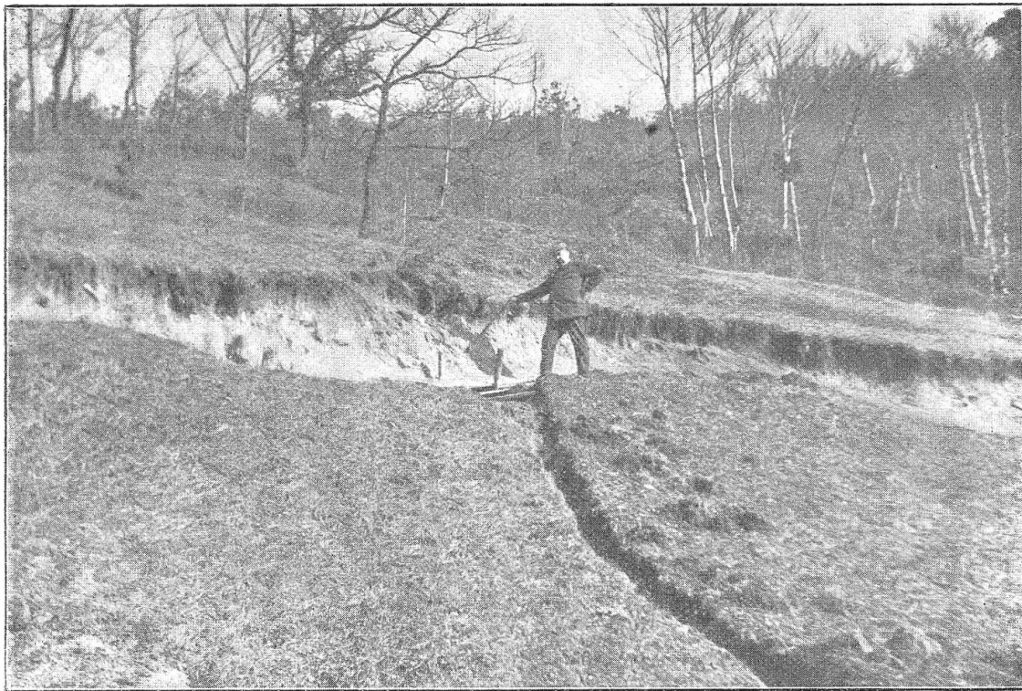
Oberste Partie der Abrißstelle, im Hintergrunde die abgeholzte Waldpartie.

Erdschliff am Murenberg, oberhalb Hof Weidli, bei Bubendorf.