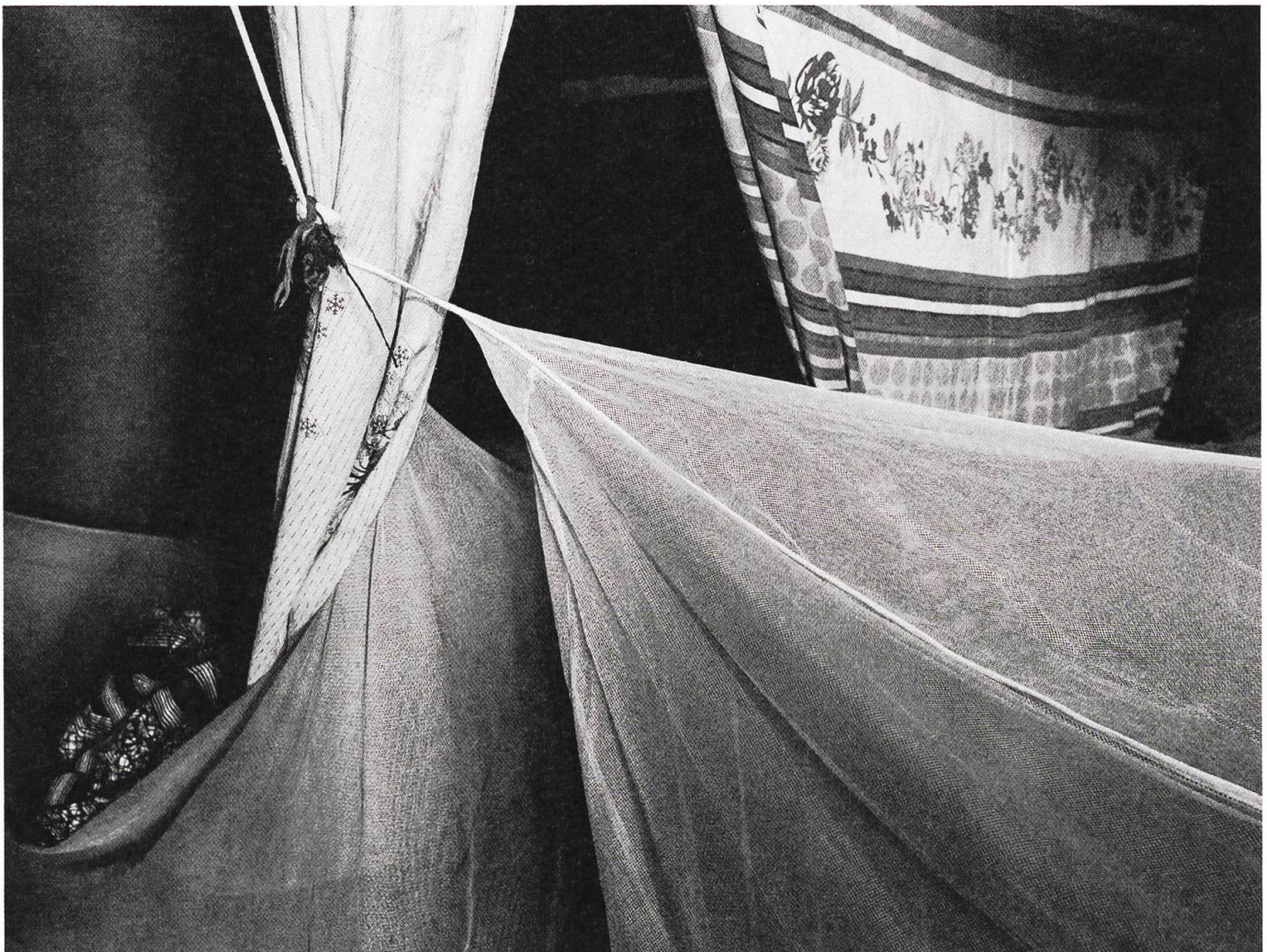
Nigeria 2017.

Moskitonetze zum Schutz gegen die Stechmücken und Tücher zum Schutz der Privatsphäre.