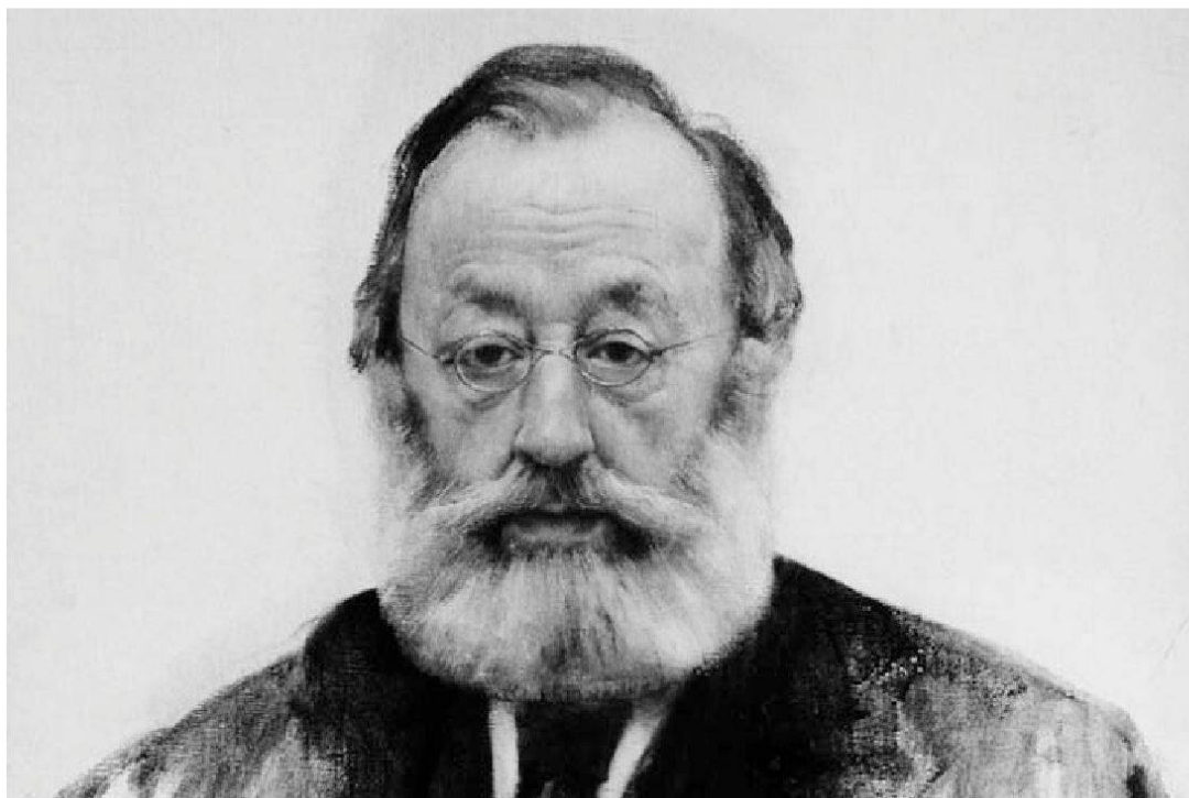
Erasmus von Rotterdam gemalt von Hans Holbein dem Jüngeren (1523), Kunstmuseum Basel, links und Gottfried Keller, 1886 gemalt von Karl Stauffer-Bern, Gottfried-Keller-Stiftung.

Ich kenne auch über Achtzigjährige, von denen mir keine körperlichen Leiden bekannt sind. Aber sie haben das Problem, dass sie aktiv sein können, aber keinen entscheidenden Einfluss mehr haben. Auch ihre Gestaltungszeit ist vorbei.