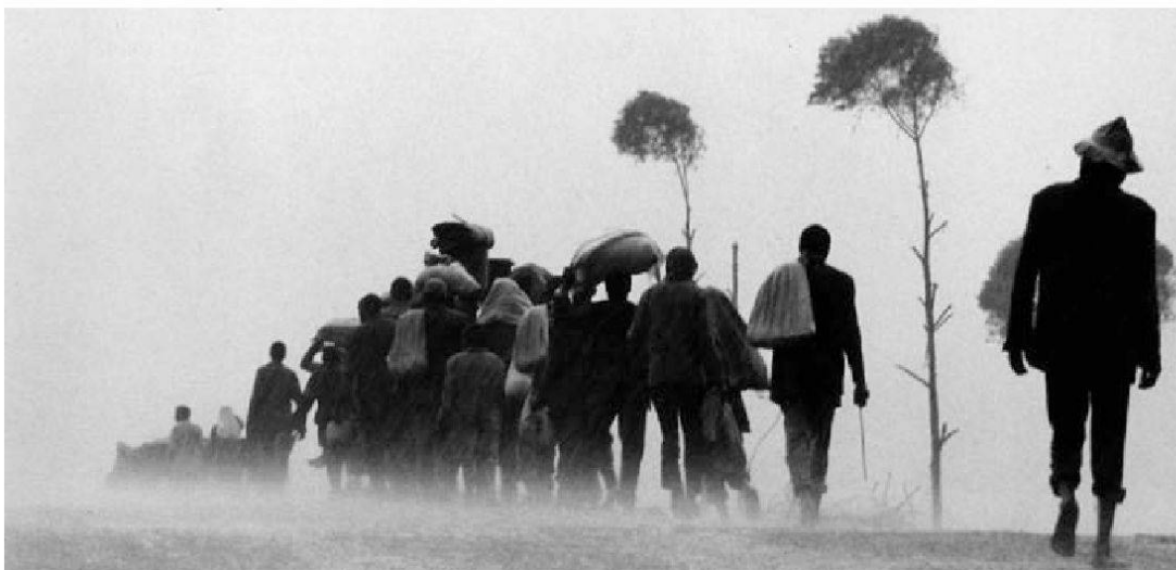
Der Bürgerkrieg in Ruanda forderte Hunderttausende Todesopfer und Flüchtlinge.