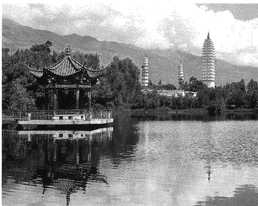
«Ex oriente lux». Der Urgrund der Esoterik ist östlich.

Wie alles zwei Seiten hat und somit Missbrauch offen steht, zeigt auch das Anliegen der amerikanischen Schwarzen mit ihrer Suche nach Wurzeln oder Roots . Mit Recht geht Esoterik der Fra-