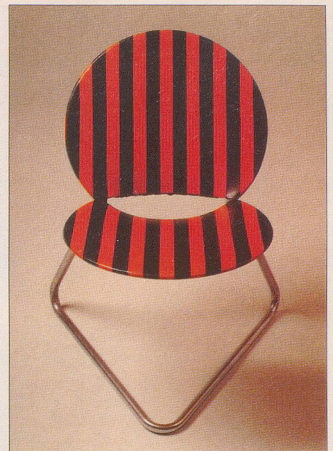
Pablo Blondino: «Stuhl mit Punkten», 1916, Lego auf Salzteig, Leihgabe der Kehrlichtverbrennungsanlage Josefstrasse / Zürich