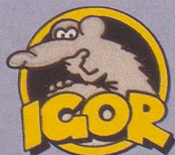
Abbildung in Originalgrösse