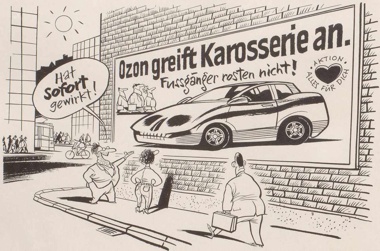
Solange das Ozon nur menschliche Organe angreift, verzichtet niemand auf sein Privatauto ...