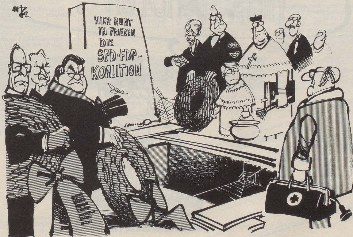
«Bedaure meine Herren, die Leiche ist immer noch ziemlich munter!»