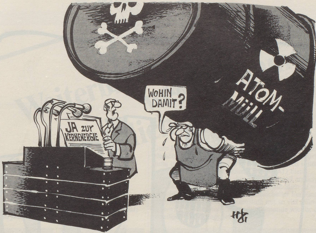
«Mann, quasseln Sie mir doch nicht immer mit Ihren Lappalien ins Konzept!»