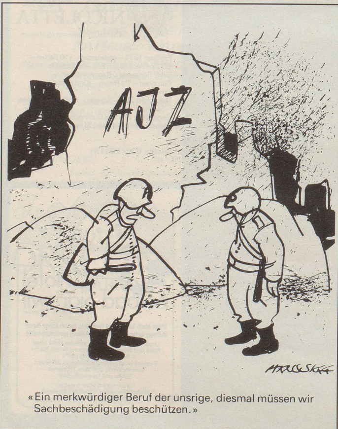
«Ein merkwürdiger Beruf der unsrige, diesmal müssen wir Sachbeschädigung beschützen.»