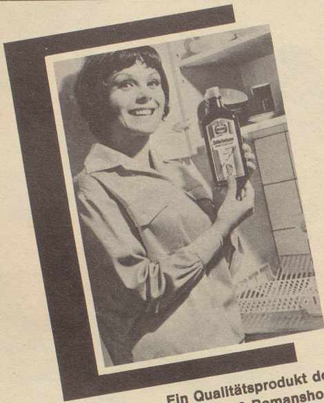
Ein Qualitätsprodukt der Max Zeller Söhne AG, 8590 Romanshorn