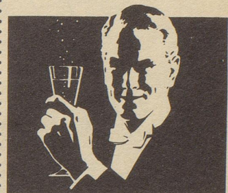
Ihr Sekt für frohe Stunden