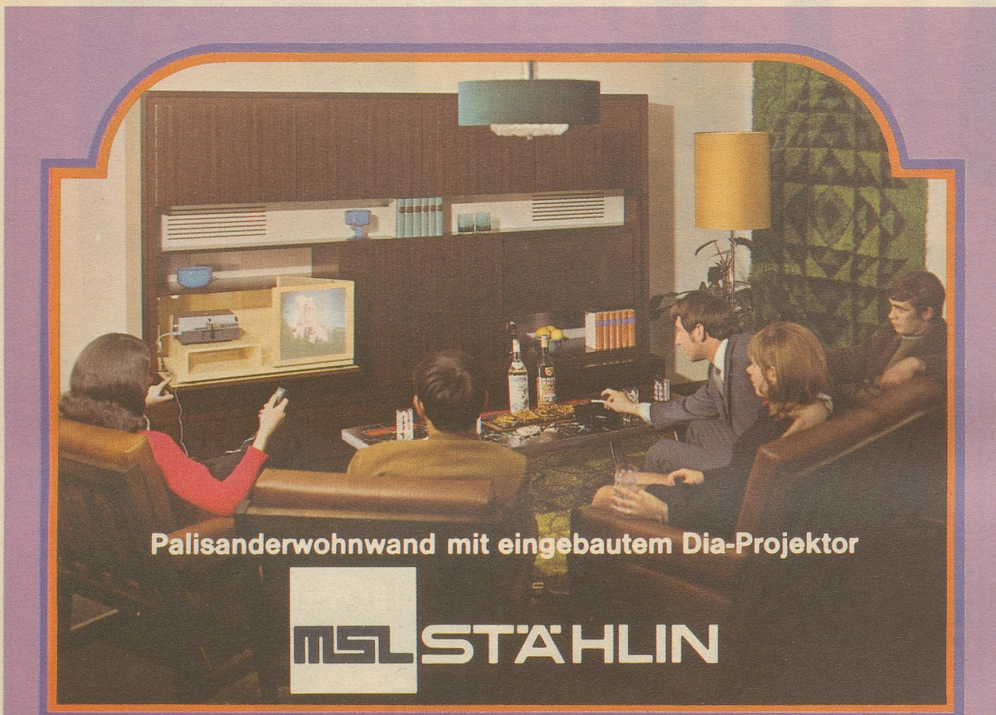
Palisanderwand mit eingebautem Dia-Projektor

In einem Inserat offeriert eine Firma ihre Waren (postfrisch). Schön, aber eigentlich hätte ich sie lieber etwas frischer. fis