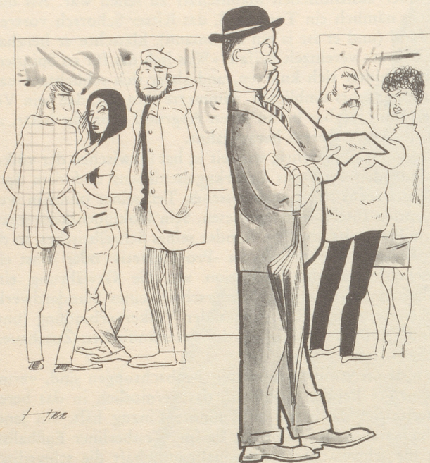
Das schwarze Schaf in der Kunstaussstellung