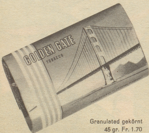
Granulated gekörnt 45 gr. Fr. 1.70

der ideale Pfeifentabak für junge und unternehmungslustige Männer. Amerikanischer Typ, sehr mild, mit reichem Aroma und kühlem Rauch.