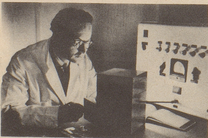
Wissenschaftlich bewiesen: Die Aufbaustoffe von Neo-Silvikrin gelangen bis in die Haarwurzeln!

Bestimmt haben auch Sie schon dies oder jenes unternommen, um den Haarausfall aufzuhalten... und das Ergebnis??? Jetzt endlich brauchen Sie nicht mehr den Mut zu verlieren, denn es gibt ja Neo-Silvikrin — die auf der ganzen Welt anerkannte biologische Haarnahrung! Die erste Voraussetzung für die Wirksamkeit eines Haarpräparates ist: Seine Wirkstoffe müssen bis in die Haarwurzeln gelangen!