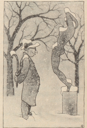
Zwei Standbilder im Stadtpark von Winterthur

Herr Mitchell tröstete mich. «Mister Troll, kommen Sie nach Amerika! Es ist ein großes Land, in dem auch einer sein Glück machen kann, der dazu nicht begabt ist. Drüben in Europa mag man von Ihnen denken wie man will, aber in Hartford, Connecticut, werde ich einen roten Läufer für Sie auslegen lassen. In drei Wochen habe ich meine depressions hinter mir und Europa gemacht. Dann erwarte ich Sie. Es ist höchste Zeit, daß man etwas für Sie tut. Einen Whisky sour für Mister Troll! Kopf hoch, Sie werden es schon noch schaffen!»