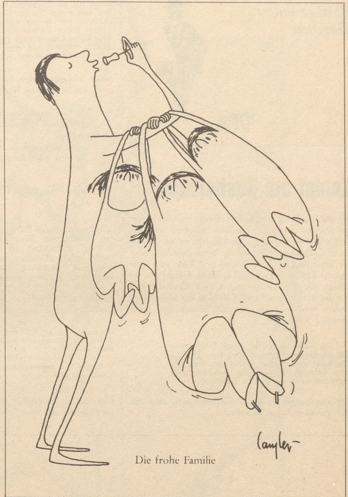
Die frohe Familie

Ein Westdeutscher fragt einen Berliner Taxichauffeur nach den politischen Aussichten. Antwortet der