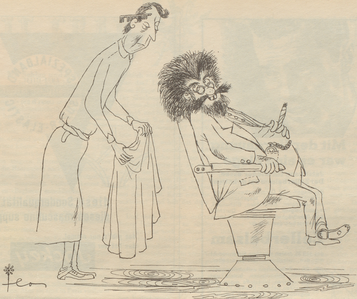
„Nume n e chli usputze bitte!“