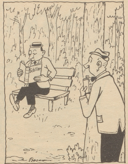
«So öppis mues me fotografiere!»

Mit dem Raumschiff hatte Katalysa nichts zu tun. Aber vielleicht brachte es Post. Ein Buchhändler von Paris hatte ihr einen Band aus der uralten Zeit versprochen. Richtig, da kam etwas durch die Röhre geflitzt, die Katalysas Wohnfach