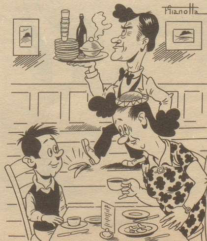
«Paß uf Mamme etz tschäderets dänn!»

Und zahllose Menschen graben Tag für Tag Gruben für andere, — nicht nur auf dem Friedhof, sondern auch auf Bauplätzen und vor allem auf den Straßen, und man hört eigentlich nie, daß sie selbst hineinfallen.