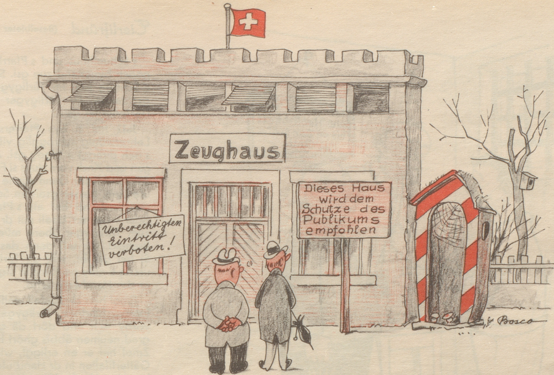
Die Selbstbedienungsläden bereiten Vorbeugungsmaßnahmen vor!