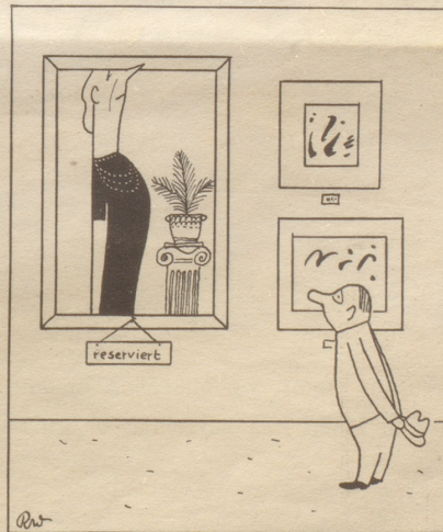
«Allerdings: die Dame gseet sehr reserviert us.»

... Es war interessant zu beobachten, wie die weiß gekleidete Cellokönigin ihren Kopf an die Schnecke lehnte und während die schwarz gekleidete Pianistin am gleichfarbigen Flügel mehr sekundierte als begleitete. WF