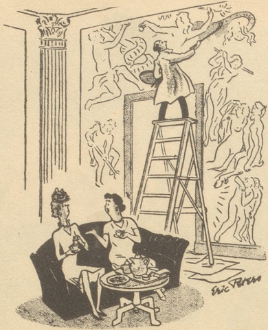
«Wir mußten diese Wand streichen lassen und konnten keinen gewöhnlichen Maler finden.» Tit-Bits