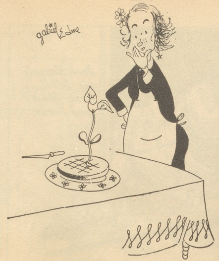
«Ich hätte doch keine Bohne in den Kuchen hineintun sollen.» Paysage-dimanche