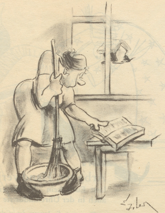
„... und im Chochbuech schtaht doch usdrückli — man rühre das Ganze mit dem Schneebesen —!“