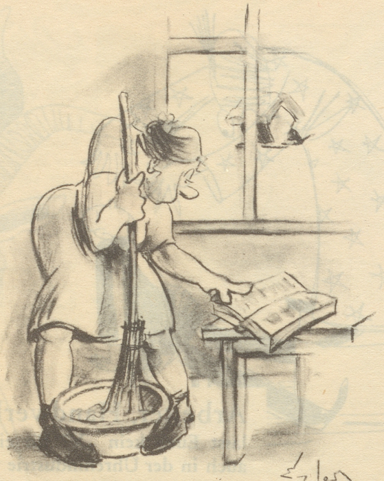
„... und im Chochbuech schtaht doch usdrückli — man rühre das Ganze mit dem Schneebesen —!“