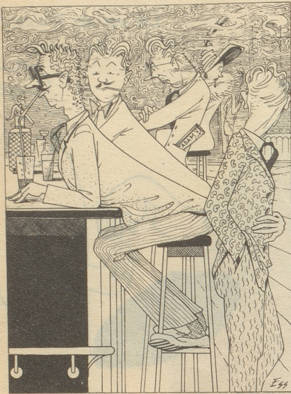
Leute mit BAR-Geld