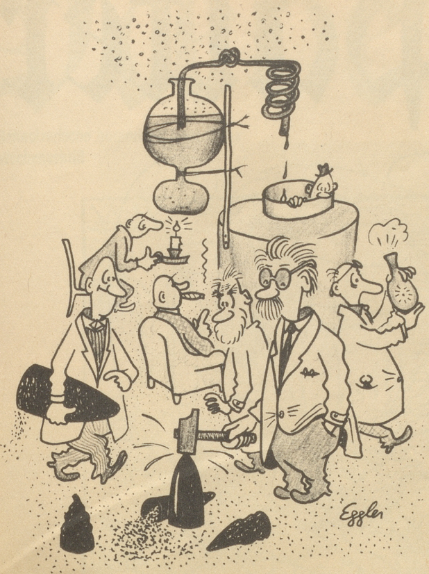
Im Club der Atombastler