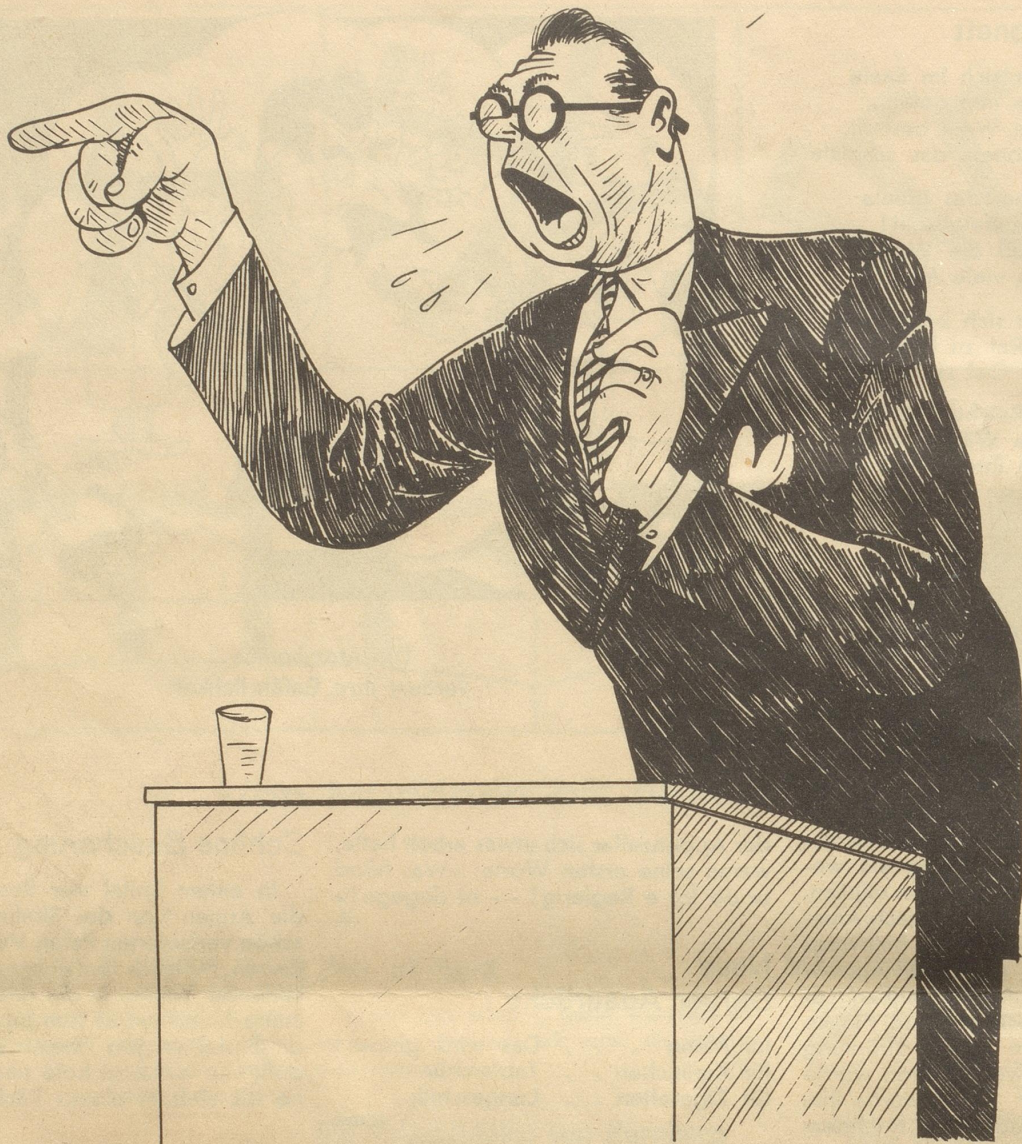
Drohende Krise in der Energieversorgung

„Und weshalb, meine Herren, gebricht es uns denn an Energie? Aus dem einfachen Grunde, weil es uns an Energie gebricht!“