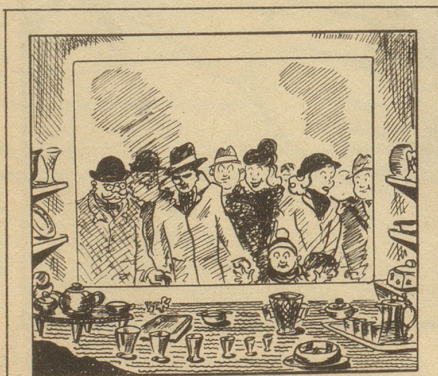
Steingut, Glas und Porzellan, Schau Jelmolis Auswahl an.