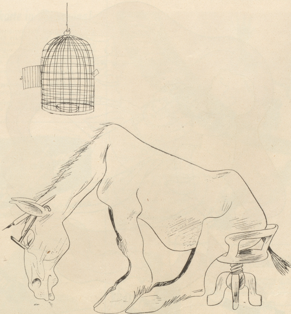
Ein Solothurner Kanzlist hielt sich in seinem Amtszimmer einen Kanarienvogel. Aber die Sache wurde ruchbar — —

So ein Benehmen, so ein verdammtes. Zum Glück kam der hochweise Rat und beschloß: Das einzige Tier unseres hochweisen Amtes Ist und bleibt unser heiliges Roß.