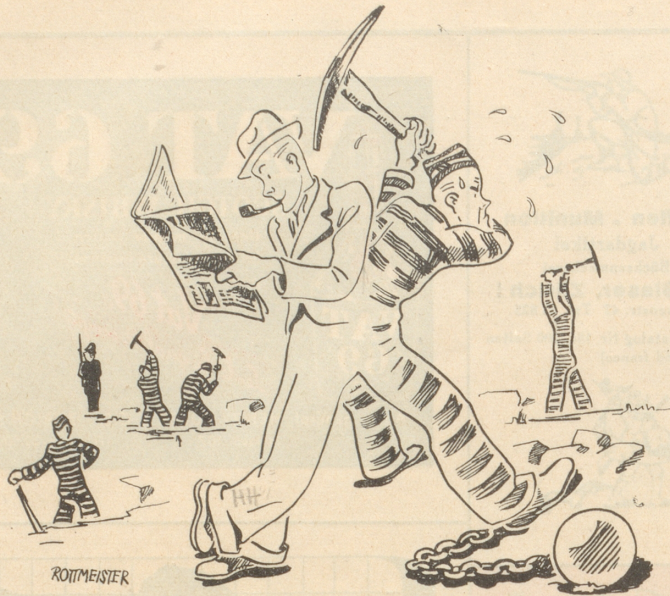
Einer der siamesischen Zwillingen wurde zu Zwangsarbeit verurteilt!