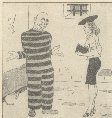
Sträfling, zum Besuch: «Entschuldigen Sie, bitte, daß ich grad im Pyjama bin!» (Il 420, Florenz)

Wenn sich auch meine Freude am leckeren Fleischschmaus schon etwas reduziert hatte, so begab ich mich frühzeitig mit neuem Mut wieder auf die Fahrt. Und siehe, der richtige Pöstler, ein freundlicher, alter Mann, stand schon hinter dem Schalter. Er plauderte vergnügt von den Genüssen dieser Welt im allgemeinen, von einem guten Schmaus im besonderen, und daß er im übrigen keine Ahnung hätte, wie solches Schweizerfleisch eigentlich schmecke. Natürlich versprach ich ihm ein «Versuecherli» davon. Eilfertig erklärte er mir den weiteren Fortgang meiner Angelegenheit: zuerst eine Mitteilung an die Zollbehörde, die er mir zuliebe gerne schreiben wolle, und dann sei nur (!) noch die Einfuhrerlaubnis vom städtischen Veterinäramt einzuholen. Mir schwindelte — — —. Als ich wieder zu Sinnen kam, schüttelte ein Bureaudiener meinen Arm, hielt mir ein Bleistiftgeschreibsel unter die Augen und führte mich hinaus. Willenlos folgte ich durch enge, winklige, schmutzige Gassen auf und ab zum